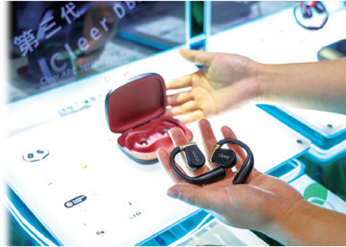
▲4月2日,在冠旭电子深圳总部拍摄的“零碳”耳机。在2024年世界地球日,冠旭电子推出全球首款开放式零碳耳机 Cleer ARC3 音弧。