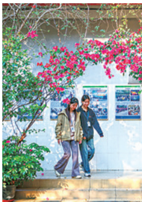
▲4月2日,员工走在冠旭电子深圳总部的园区里。

“绿美”理念正成为企业稳守当下与进取未来的“绿色通行证”,冠旭电子相关负责人表示:“工厂近年来持续提升清洁能源使用比例,今年预计达到100%,我们下一步还要带动供应商一起节能减排。”