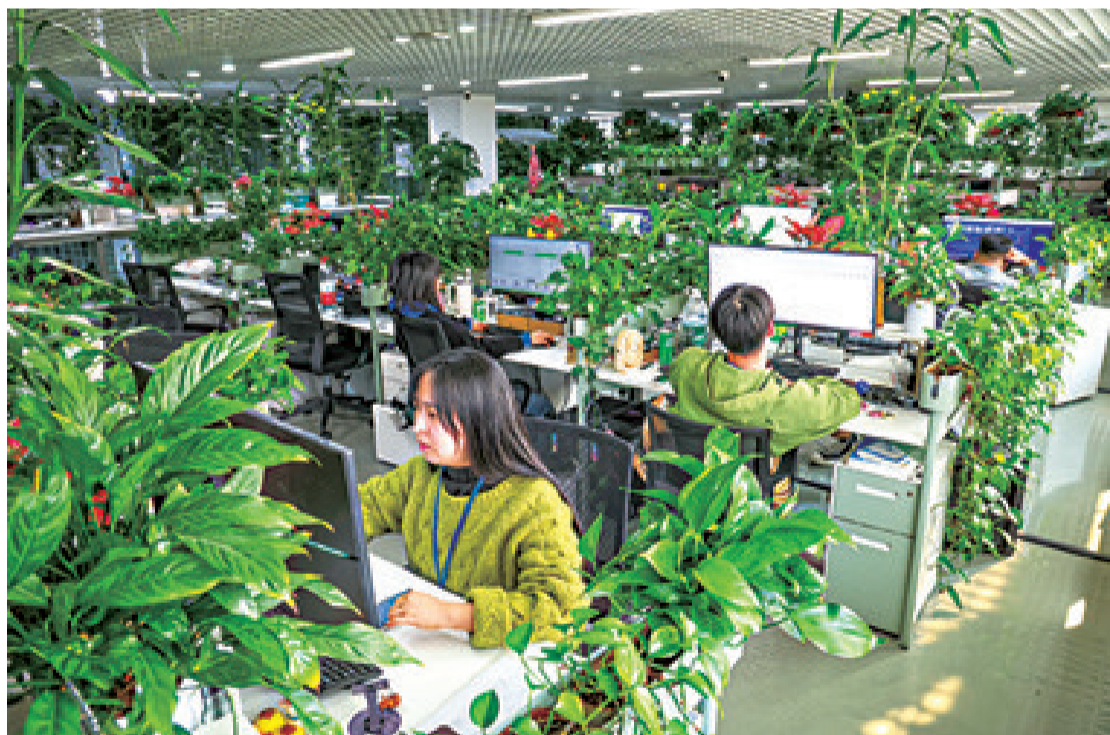
▼4月2日,员工在冠旭电子深圳总部的办公区域工作。