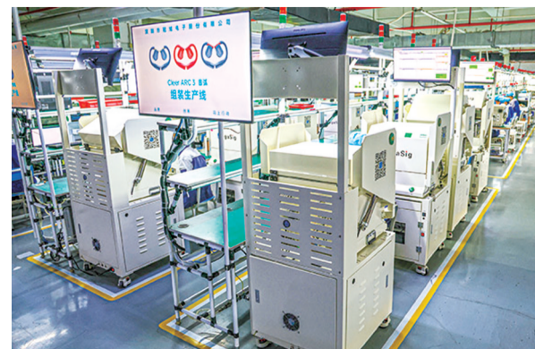
▼4月2日,在冠旭电子深圳总部拍摄的耳机组装生产线。