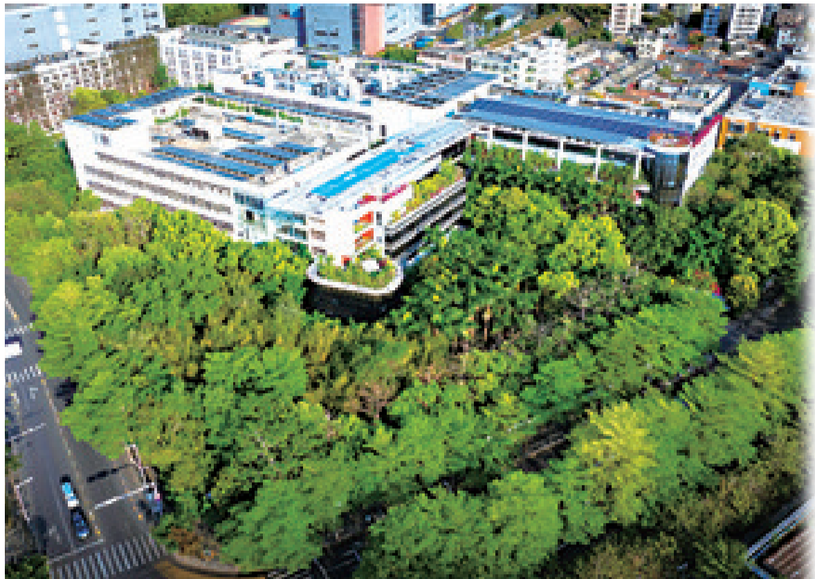
▲4月2日拍摄的“森林”中的冠旭电子深圳总部,屋顶上安装了光伏板。