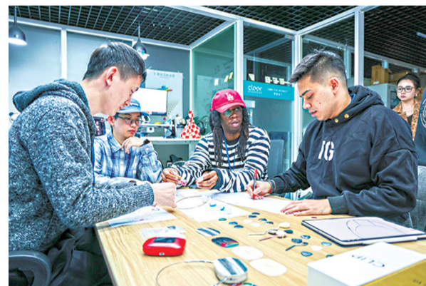
▲4月2日,在冠旭电子深圳总部,设计团队在打磨新款耳机产品。