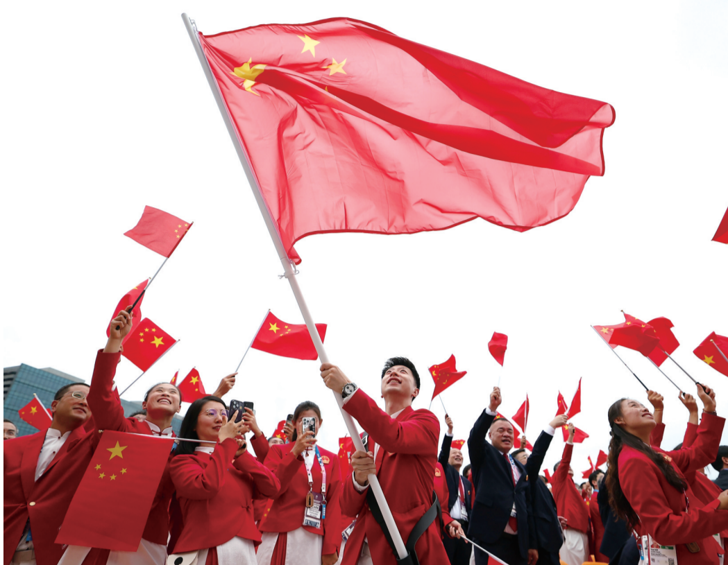
2024年7月26日,在法国巴黎举行的第33届夏季奥林匹克运动会开幕式正式拉开帷幕,中国体育代表团旗手挥舞国旗。