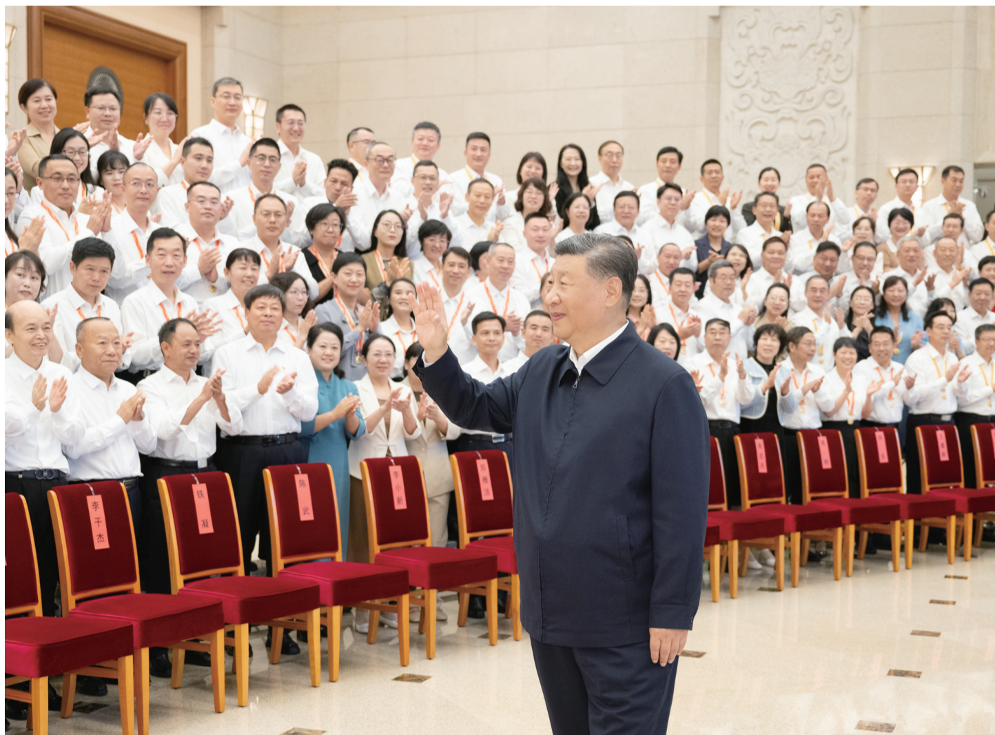
9月9日至10日,全国教育大会在北京召开。中共中央总书记、国家主席、中央军委主席习近平出席会议并发表重要讲话,代表党中央向全国广大教师和教育工作者致以节日祝贺和诚挚问候。