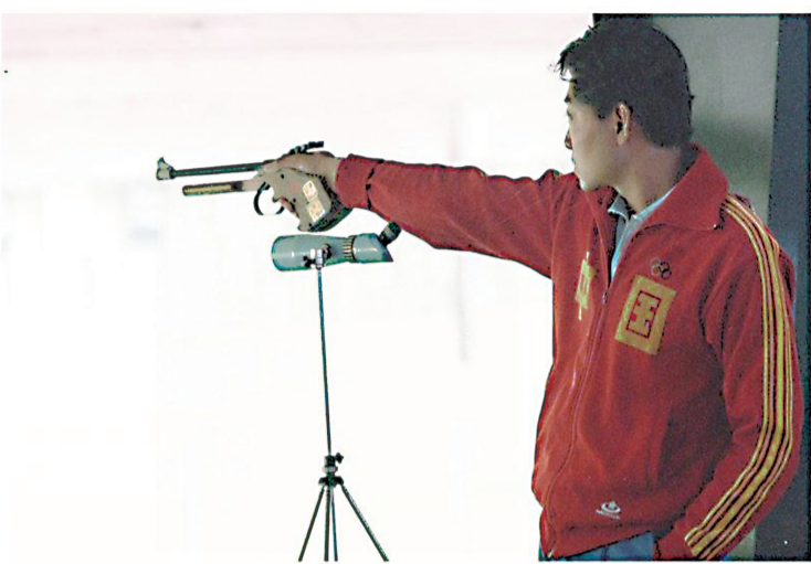
1984年7月29日,许海峰在第23届洛杉矶奥运会男子自选手枪慢射比赛中获得冠军,实现了中国奥运金牌“零”的突破。