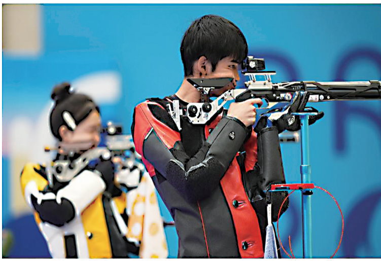
2024年7月27日,黄雨婷/盛李豪(右)在巴黎奥运会10米气步枪混合团体比赛中夺冠,赢得巴黎奥运会首枚金牌。

在宽容与鼓励中,她重整旗鼓,5天后,副项问鼎,逆境重生。“这是难能可贵的,我们更看重杜丽这种百折不挠、自强不息的精神。”时任中国体育代表团