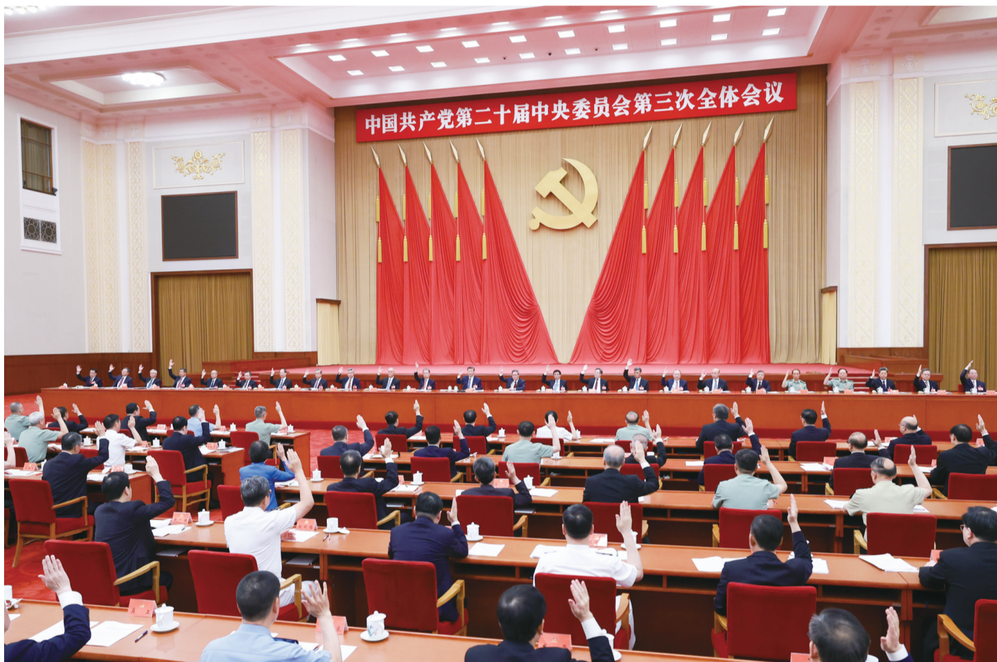
中国共产党第二十届中央委员会第三次全体会议,于2024年7月15日至18日在北京举行。中央委员会总书记习近平作重要讲话。