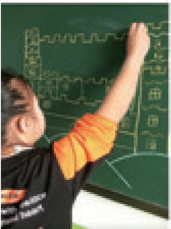
小迪在班级学习园地墙上画板报。