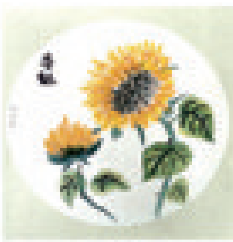
特教学生国画作品《夸魁》。