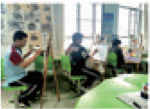
聋部高二学生在校画室模拟高考作画。