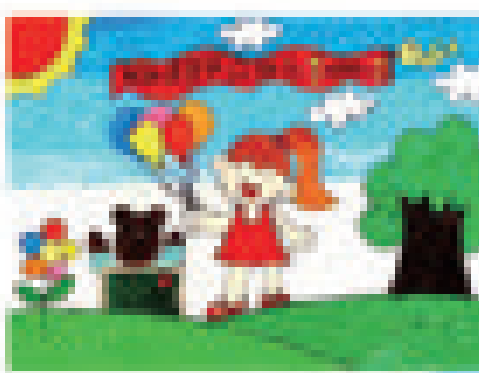
美淇在小学六年级毕业前夕创作的《毕业快乐》。