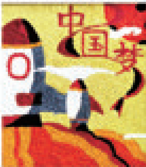
特教学生纸浆画作品《中国梦》。