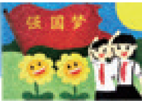
特教学生纸浆画作品《强国梦》。

学生学习音乐的兴趣,促进学生综合音乐素质的培养并激发学生审美能力和创造美的能力,有着重要的作用。音乐教育本体目标是音乐感受、理解、表现及创新能力培养。通过感受美、认识美和欣赏美、表现美等,从而发展创造美的能力。我是一双儿女的母亲,但更是全校学生的老师。这双重身份让我有着双重的责任感和使命感。我也享受这双重身份。因为这使我可以见证孩子们的每一次进步、每一次成长,哪怕是一点点的进步,都让我倍感欣喜。所以,我和孩子们都要感谢党和国家,感谢新时代赋予我们这美好的一切。”