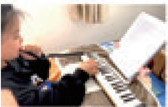
可乐在口风琴课上专注地学习。