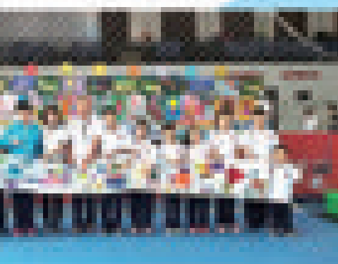
▲市特殊教育学校培智美术社团汇报展示。

本版稿件由本报记者 王超 采写 本版策划 李锋 注:文中提到的所有学生名字均为化名