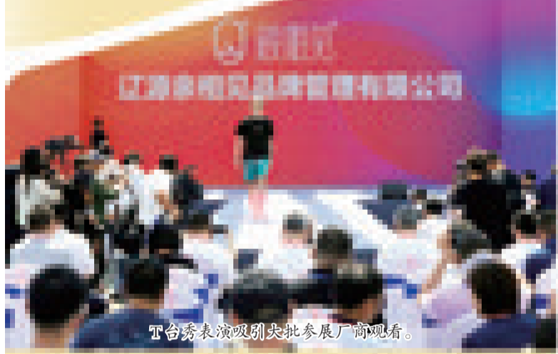
T台秀表演吸引大批参展厂商观看。

7月1日,为期4天的第六届中国·辽源国际袜业交易博览会开幕。来自全球各地的袜业生产商、经销商、采购商以及行业专家齐聚一堂,共同展示和交流袜业领域的新技术、新产品和新趋势。