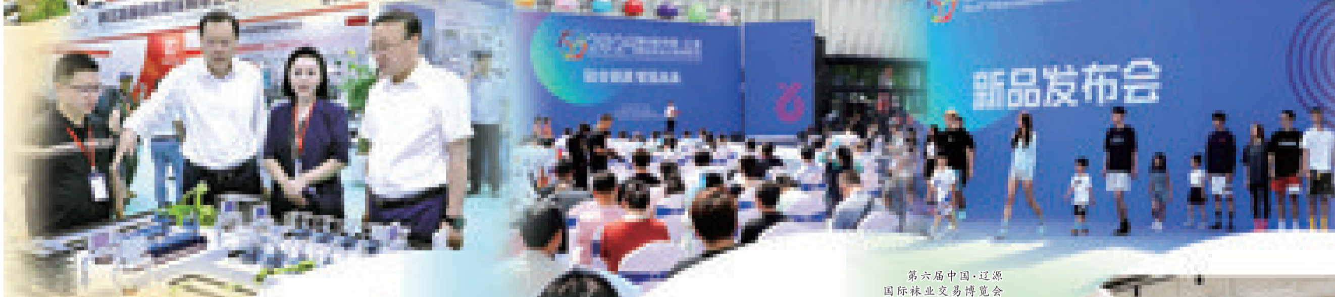
市委书记沈德生、市长程宇亲临展会现场指导工作。