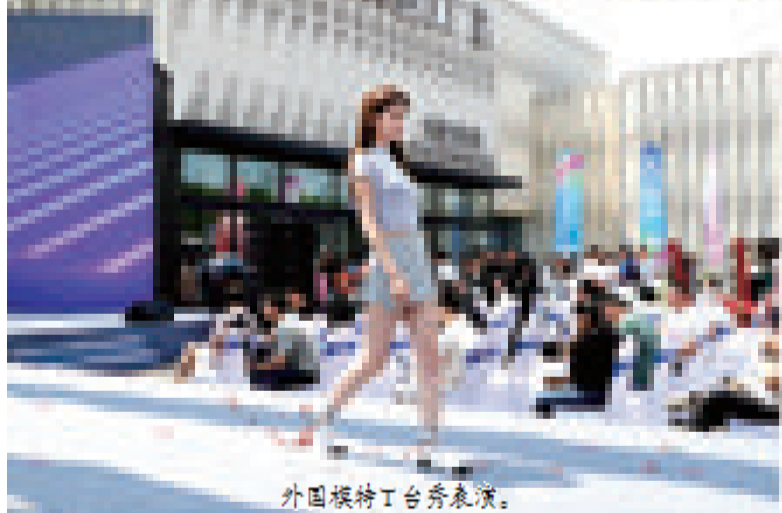
外国模特T台秀表演。

本版稿件由本报记者 宋建立 田蓓蕾 徐楠 采写 本版策划 夏景明