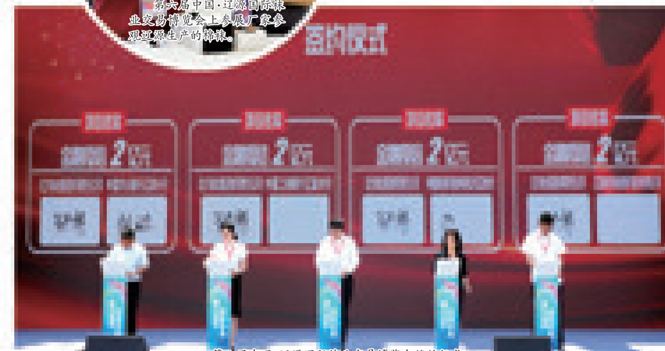
第六届中国·辽源国际袜业交易博览会签约仪式。