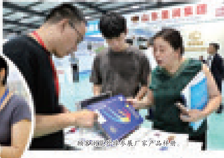
第六届中国·辽源国际袜业交易博览会上参展厂家参观辽源生产的棉袜。