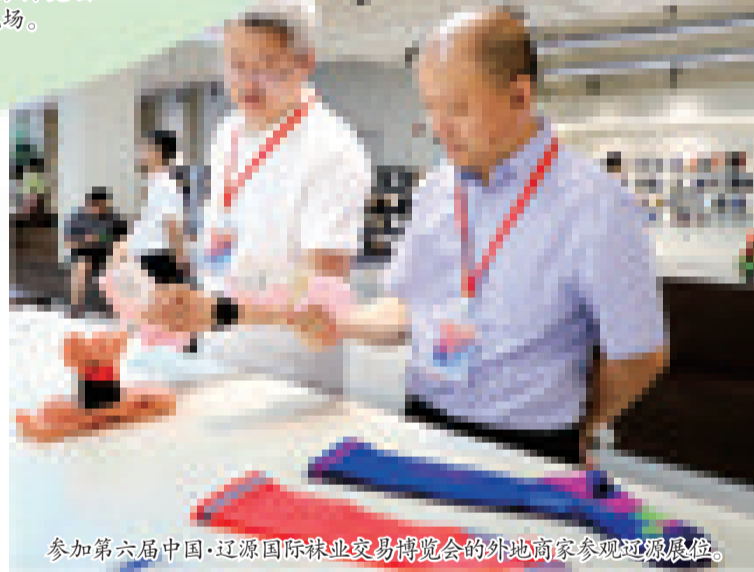
参加第六届中国·辽源国际袜业交易博览会的外地商家参观辽源展位。

走过山川,走过精彩的发展之路,绘制缤纷壮丽蓝图,辽源袜业必将开创一个高质量发展崭新格局!