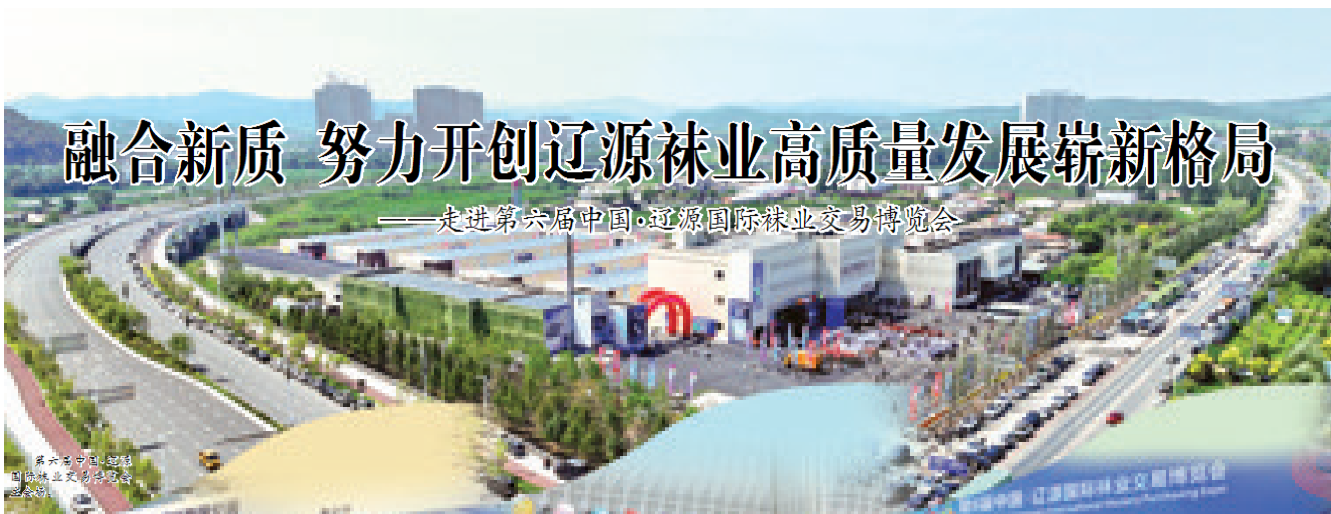
第六届中国·辽源国际袜业交易博览会主会场。