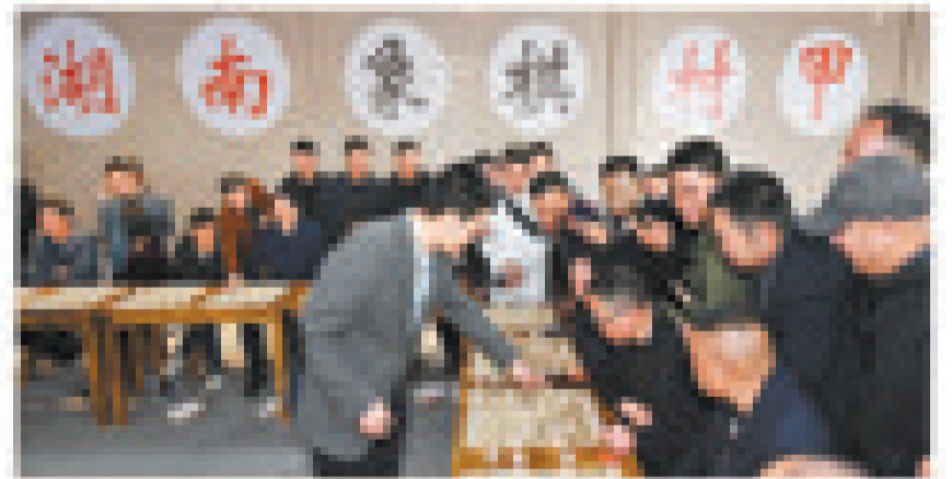
湖南省岳阳市湘阴县鹤龙湖镇,中国象棋特级国际大师许银川(前左)在和美丽乡村中国象棋乡村甲级联赛暨大师挑战赛中与村民展开“车轮战”。