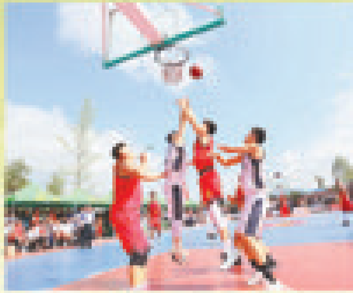
甘肃省静宁县城关镇南关村,选手在甘肃省首届和美乡村篮球大赛中比拼。