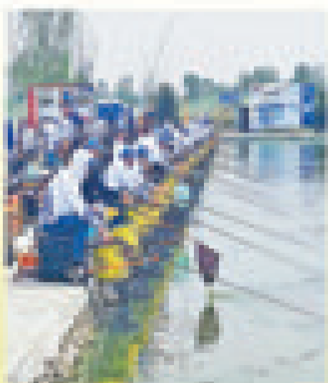
天津市宝坻区黄庄镇,选手在垂钓比赛中。