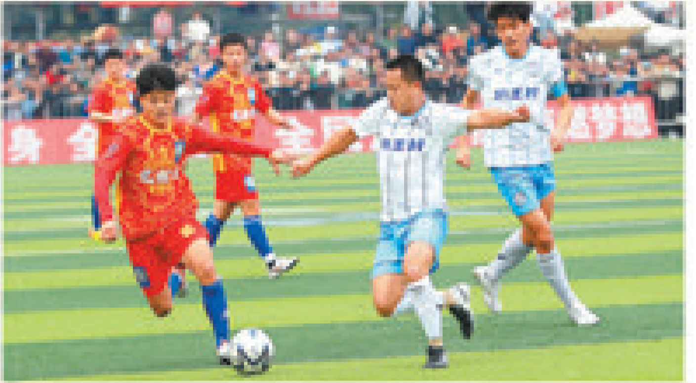
贵州省榕江县,选手在第二届贵州“村超”总决赛中拼抢。