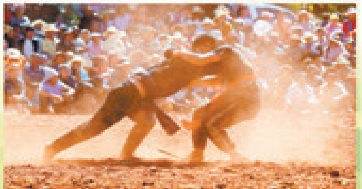
云南省红河哈尼族彝族自治州弥勒市攀枝彝族村,“乡村振兴杯”传统民族摔跤比赛,选手展开较量。