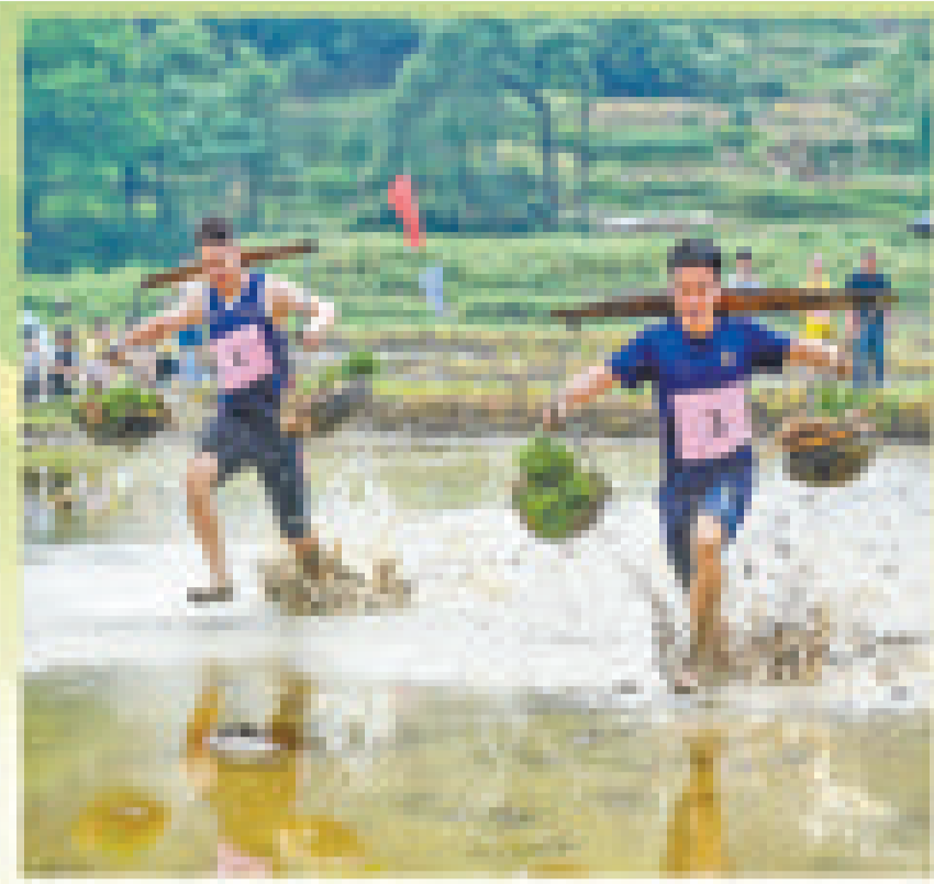
江西省宜春市袁州区天台镇坑西村,首届春耕田间趣味运动会,选手进行运秧比赛。