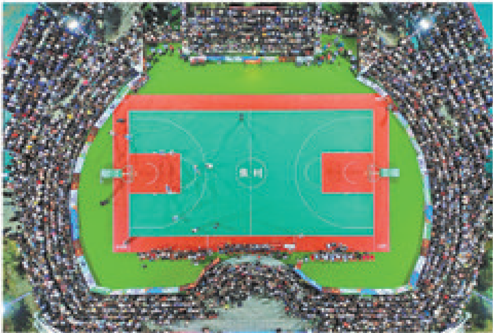
河南省灵宝市焦村镇,河南省和美乡村篮球大赛总决赛,比赛现场热闹非凡。