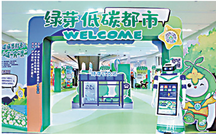
“绿芽积分”线下推广活动——绿芽低碳都市。