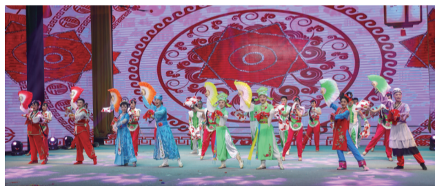
山杏艺术团对非遗项目的保护与传承优势更加明显,实力更加壮大。