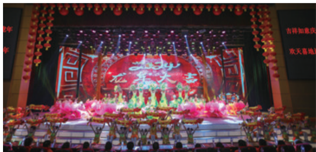
山杏艺术团为东辽县巩固“中国民间文化(艺术)之乡”称号、保持吉林省非物质文化遗产鲜亮品牌作出了积极的贡献。

逐村逐户、送戏、送歌声、送惊喜。他们的歌声飘扬在农家,飘扬在田间地头,遍布村屯每一个角落。 东辽县的各种大型文艺演出更离不开山杏艺术团。每年东辽县的春节文艺晚会都由山杏艺术团负责排演所有节目。他们每年公益演出和商业演出100多场,对传承、振兴东辽二人转艺术事业起到了积极的推动作用。说起山杏艺术团,在有着全国“二人转之乡”美誉的东辽县可谓无人不知。这个农村业余小剧团已走过了41年的风雨历程。如今,成了东辽县文化艺术发展的顶梁柱。