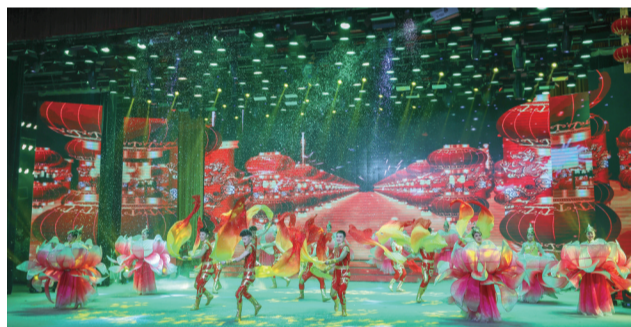
目前,山杏艺术团麾下20名演乐人员,均为东辽二人转第19代传承人。