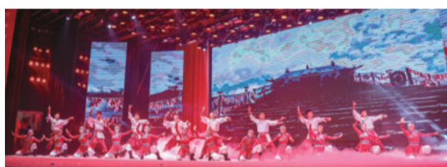
排演紧扣时代脉搏、弘扬主旋律的新剧目50余部,再现传统经典老剧目20余部。