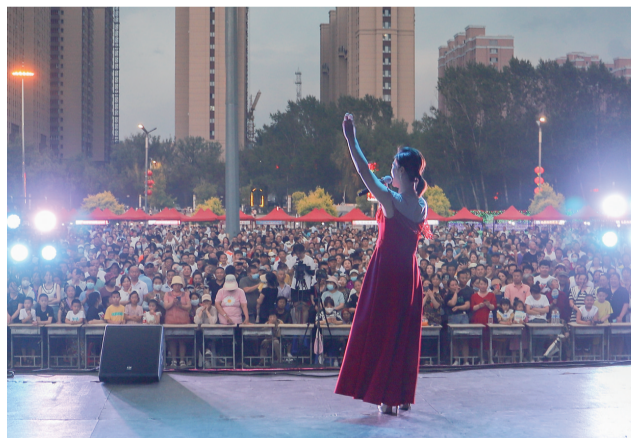
2015年山杏艺术团被中宣部、文化部、广电总局评为第六届全国“服务农民、服务基层”文化建设先进集体。

历经了四十一年的发展,现如今的山杏艺术团多次被中宣部、文化部及吉林省授予“服务农村、服务基层”先进单位,为东辽县赢得了文化部命名的“中国民间文化艺术(二人转)之乡”“全国文化先进县”等殊荣。山杏艺术团为繁荣东辽文化事业、满足广大群众文化需求作出了积极贡献。繁荣发展文化事业和文化产业的春风正劲吹东辽大地,我们相信,春风劲吹山杏红,山杏花开香更浓。