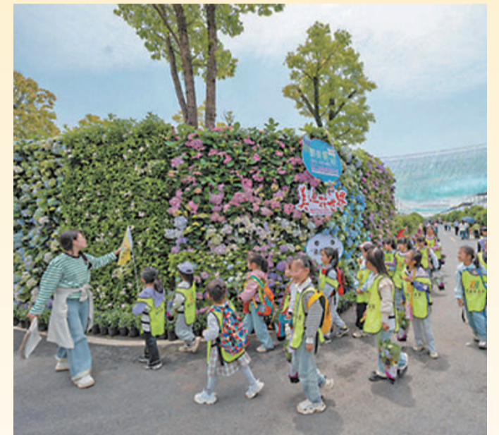
安徽省宣城市郎溪县涛城镇庆丰村花卉基地,老师带着小朋友们参观研学。