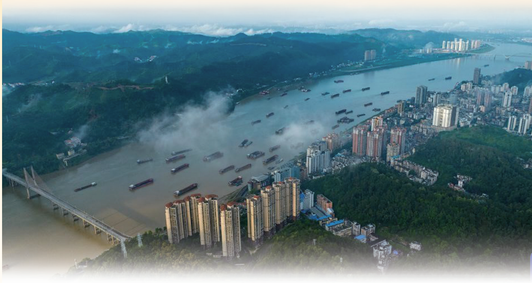
5月5日,在西江航运千吨广西梧州市区段,往来船舶如梭(无人机照片)。