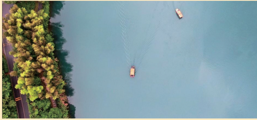
▲5月5日,游客乘坐游船在湖南省资兴市东江湖景区小东江景点游玩赏景(无人机照片)。(新华社发 李科 摄) ▲新疆维吾尔自治区乌鲁木齐市科技馆,游客在体验隔空点灯实验。孙振常 摄