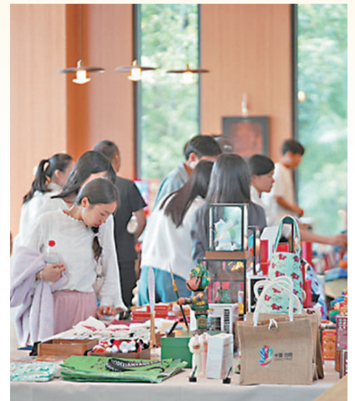
湖北省当阳市花溪湿地,游客在选购文创产品。