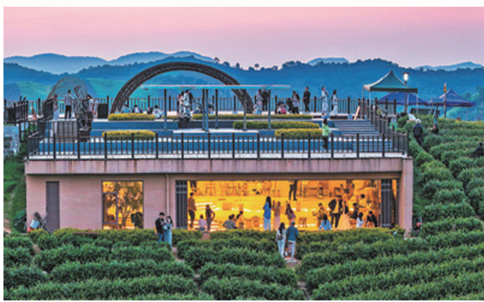
浙江省湖州市安吉县溪龙乡白茶观景平台上,游客体验农文旅新业态。

“五一”假期,文旅市场延续加快恢复势头,呈现供需两旺的发展态势。从文化馆到商业街区,从红色旅游到乡村旅游,从短途周边游到远距长线游,新业态新场景不断涌现,文旅消费潜能持续释放。