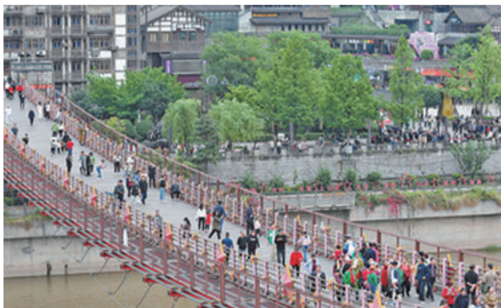
贵州省仁怀市茅台镇茅台渡口,游客在铁索桥上行走。