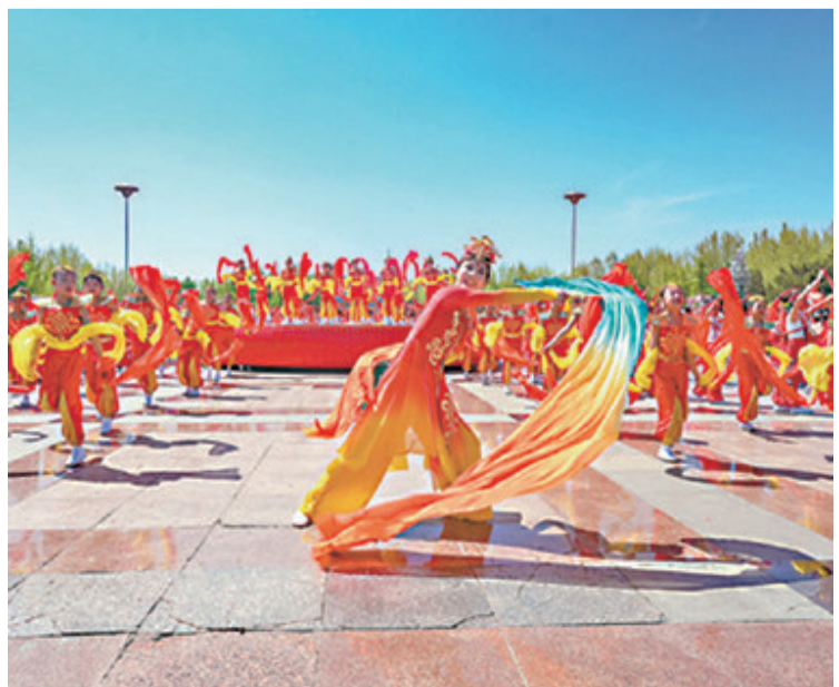
河北省乐亭县举行的“五月青春秀”文化活动中,演员在表演。