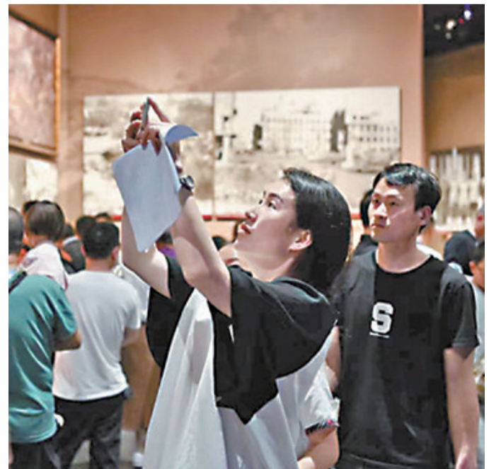
辽宁省丹东市抗美援朝纪念馆内,观众在展板前拍照。