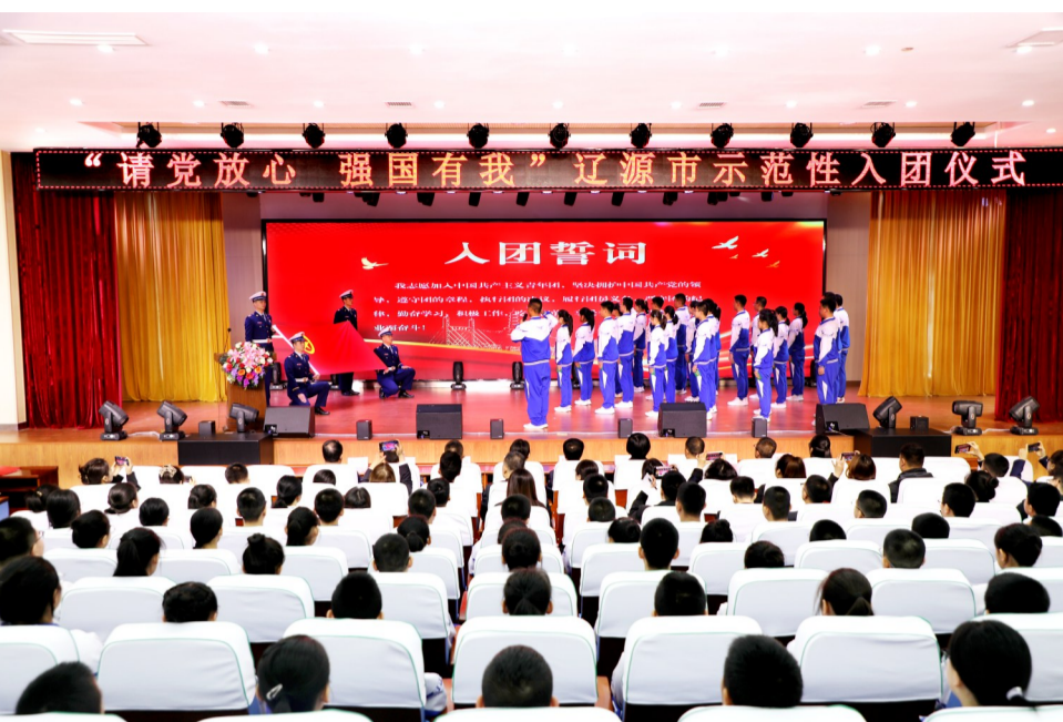
“请党放心、强国有我”示范性入团仪式活动中新团员入团宣誓。

平,这种“立行立改立治”的做法,赢得小区居民的拍手称快。四百综合楼是无物业管理小区,现由街道代管。北寿街道针对居民在平台处乱堆乱放和种地行为进行治理,清除垃圾10余车,为居民创造洁净的居住环境。北寿街道将继续发挥物业主力军、社区自治功能和居民主人翁的联合作用,持续开展环境整治工作,为居民创造良好的生活环境。