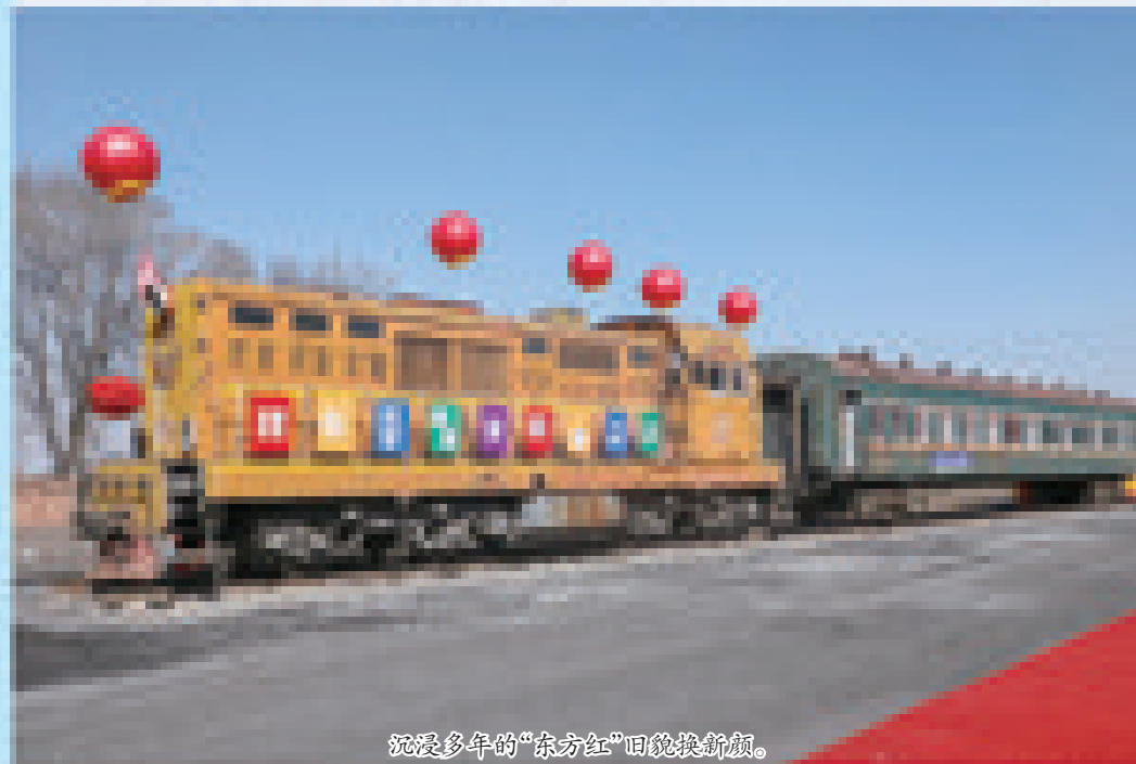
沉浸多年的“东方红”旧貌换新颜。