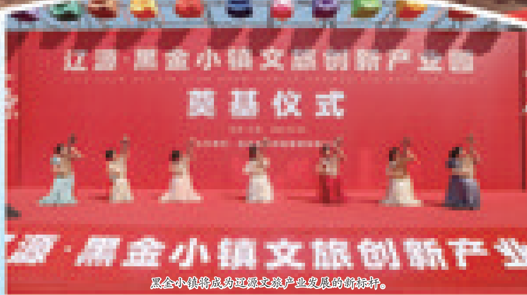
辽源·黑金小镇文旅创新产业园奠基仪式