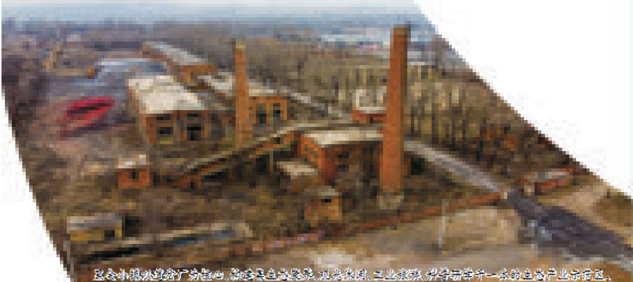
黑金小镇以道岔厂为核心,新建集生态康养、观光休闲、工业旅游、科普研学于一体的生态产业示范区。