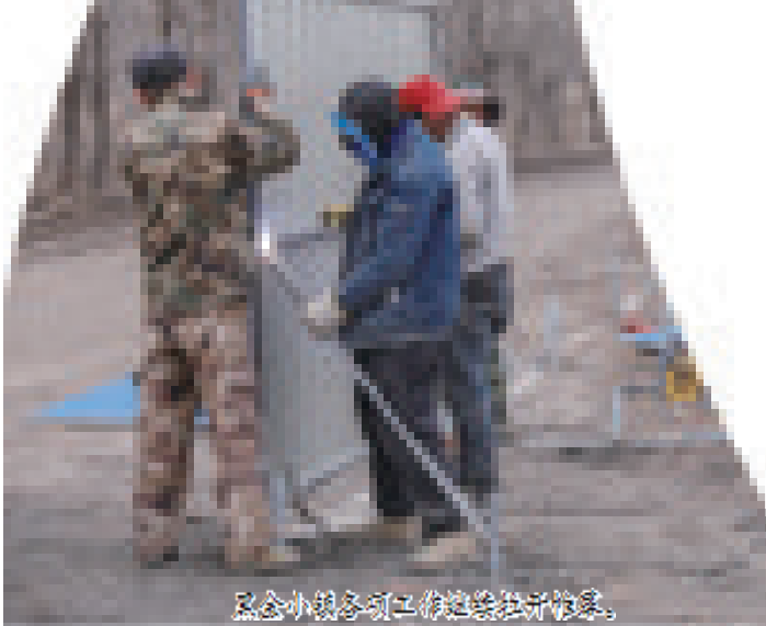
黑金小镇引进工作进驻拉开序幕。