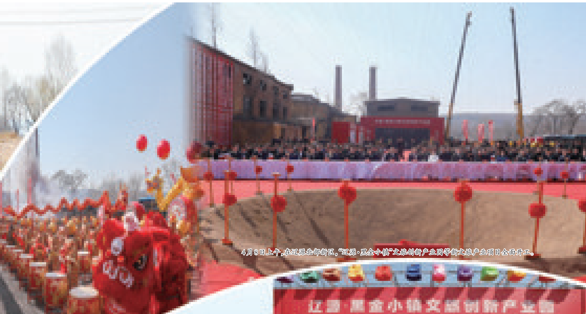
4月8日上午,在辽源北部新区,“辽源·黑金小镇”文旅创新产业园等文旅产业项目全面开工。