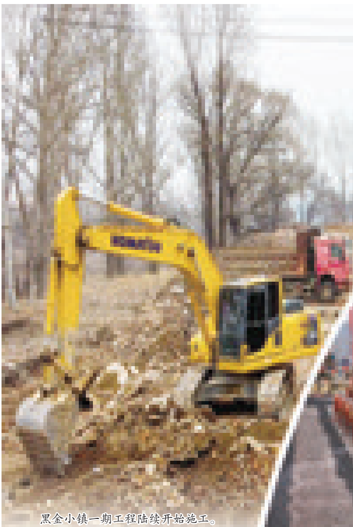
黑金小镇一期工程陆续开始施工。

治理采煤沉陷区,是辽源市建设与发展的民生之举。吉林金豆集团在我市西北部采煤沉陷区投资建设集生态康养、观光休闲、工业旅游、科普研学于一体的黑金小镇/文旅创新产业园项目,既是对辽源百年煤城历史和矿山文化的传承,更是落实市委八届五次全会“推动辽源由传统煤炭基地向现代零碳高地转变”的重要探索和以新文旅引领生态环境转型的生动实践,不仅给沉陷区带来新的生机与活力,而且吸引全市周边的游客及学生来这里度假、研学,为辽源市民提供一处休闲、娱乐、创业、回忆的艺术空间,更为我市开启西北部采煤沉陷区综合治理和充分利用现有资源拉开了序幕,吹响了“冲锋号”、发出了“最强音”。