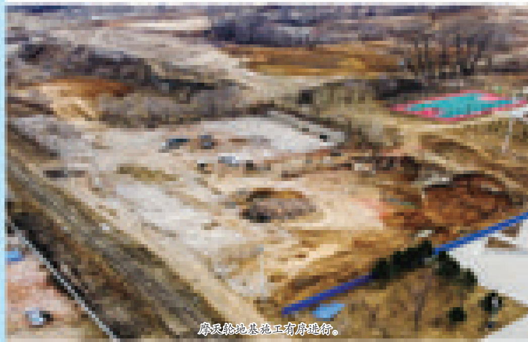
摩天轮地基施工有序进行。