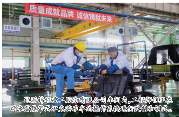
辽源锦程重工股份有限公司车间内,工程师们正在对冰雪履带式坦克游乐车的操作系统进行改制和调试。