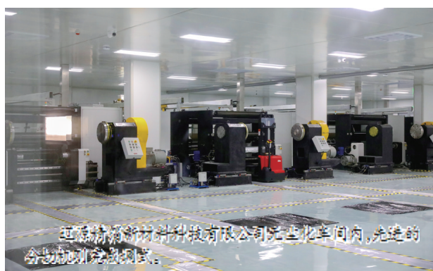
辽源精箱新材料科技有限公司无尘化车间内,先进的分切机正在调试。