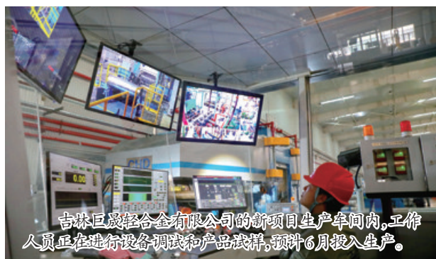
吉林巨晟轻合金有限公司的新项目生产车间内,工作人员正在进行设备调试和产品试样,预计6月投入生产。