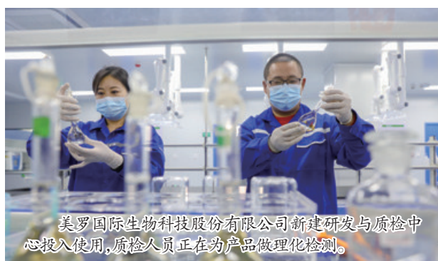
美罗国际生物科技股份有限公司新建研发与质检中心投入使用,质检人员正在对产品做理化检测。