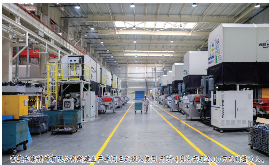
启星铝业有限公司新建生产车间正式投入使用,预计4月份实现2000万元销售投入。