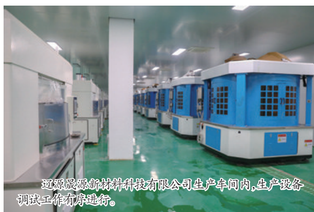
辽源晟源新材料科技有限公司生产车间内,生产设备调试工作有序进行。