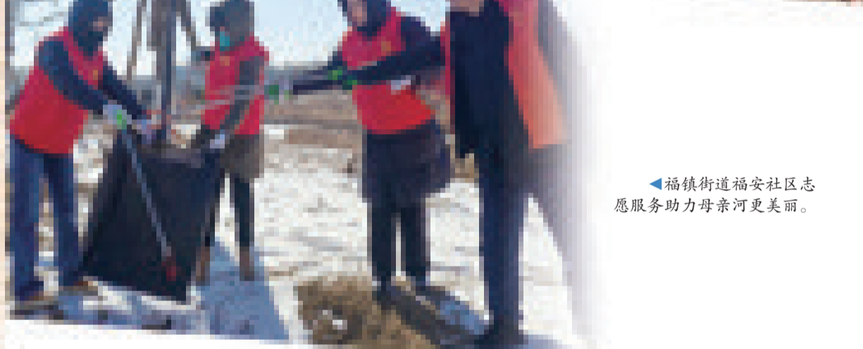
福镇街道福安社区志愿服务助力母亲河更美丽。