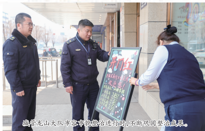
城管龙山大队市容环境整治进行时,不断巩固整治成果。