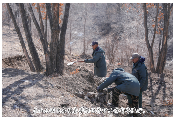
东山公园内各项春季绿化养护工作有序推进。

典型案例分析、春季安全行车知识、驾驶员生理心理健康辅导、行车中突发情况应急预案、文明服务相关知识、典型有责投诉案例分析等内容。活动旨在进一步加强安全生产工作及加强和规范公司安全教育培训工作,逐步建立一支驾驶技术精湛、安全意识强、驾乘沟通能力强、职业道德高尚、服务水平高,熟知相关法律法规、具有良好的心理素质的驾驶员队伍。