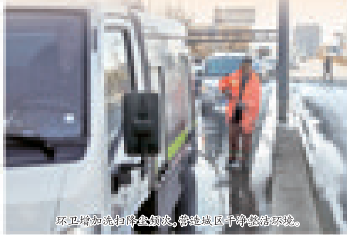
环卫增加洗扫频次,营造城区干净整洁环境。

处。同时,督促辖区商户落实“门前三包”责任,明确责任区域、责任内容等。接下来,城管龙山大队将一鼓作气,以精细化、规范化、长效化管理为基础,通过“执法+服务”的方式打好解决城市管理“顽瘴痼疾”的组合拳,努力做到整治一片、规范一片、长效保持一片,以“绣花精神”切实当好“城市管家”。