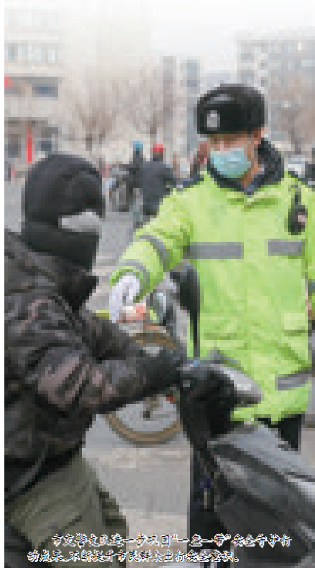
市交警支队进一步巩固“一盔一带”安全守护行动成果,不断提升市民出行安全系数。