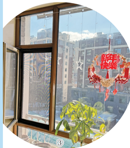
随着科技的发展,我们的生活越来越依赖各种电子设备。

备,这也给很多不法分子留下了有机可乘的机会,电子屏幕上偶尔跳出的特殊网站让我们不禁担起网络安全的问题,那么,我们应该如何应对这些潜在的网络风险呢?