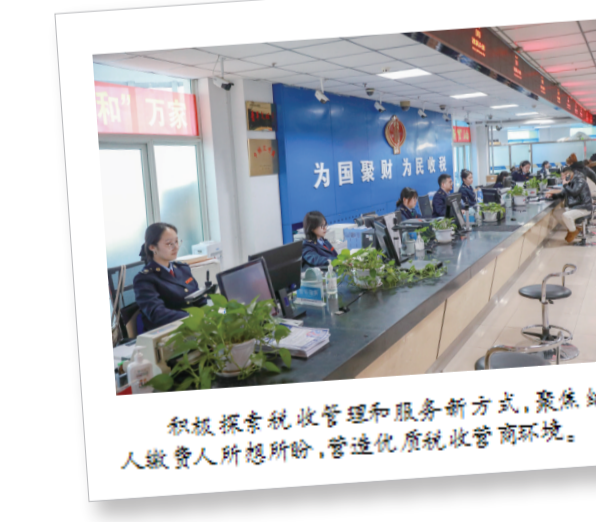
积极探索税收管理和服务新方式,聚焦纳税缴费人所盼,营造优质税收营商环境。