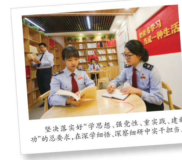
坚决落实好“学思想、强党性、重实践、建新功”的总要求,在深学细悟、深察细研中实干担当。