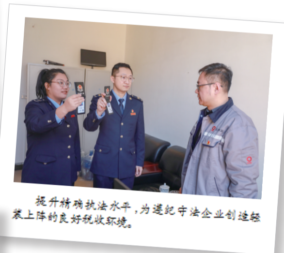
提升精确执法水平,为遵纪守法企业创造轻装上阵的良好税收环境。