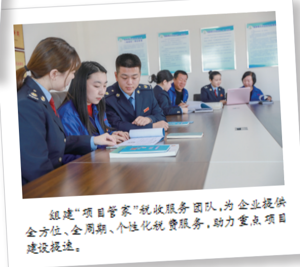
组建“项目管家”税收服务团队,为企业提供全方位、全周期、个性化税费服务,助力项目建设提速。