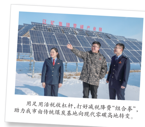
用足用活税收杠杆,打好减税降费“组合拳”,助力我市由传统煤炭基地向现代零碳高地转变。