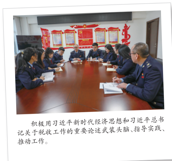
积极用习近平新时代中国特色社会主义思想和习近平总书记关于税收工作的重要论述武装头脑、指导实践、推动工作。

理的第三次革命,加强前瞻性思考、全局性谋划,立足职能,紧盯新经济、新业态发展动向,积极探索税收管理和服务新方式,让税收征管与新经济形态相匹配,以帮助解决现有税收体制可能顾及不到的一些现象和问题。要坚持包容审慎原则,考量新经济新业态的特性,有针对性地完善征管手段,积极支持新产业、新业态、新模式健康发展,帮助企业把握发展良机,不断发展壮大。