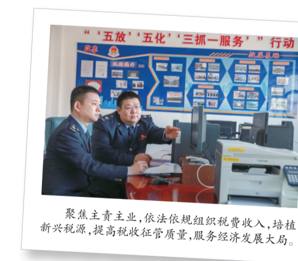
聚焦主责主业,依法依规组织税费收入,培植新兴税源,提高税收征管质量,服务经济发展大局。