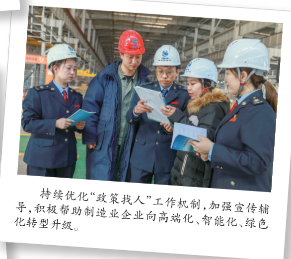
持续优化“政策找人”工作机制,加强宣传辅导,积极帮助制造业企业向高端化、智能化、绿色化转型升级。