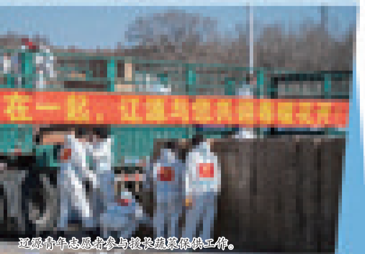
辽源青年志愿者参与长春蔬菜保供工作。