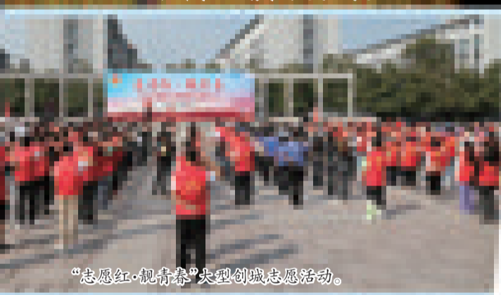
“志愿红·靓青春”大型创城志愿服务活动。