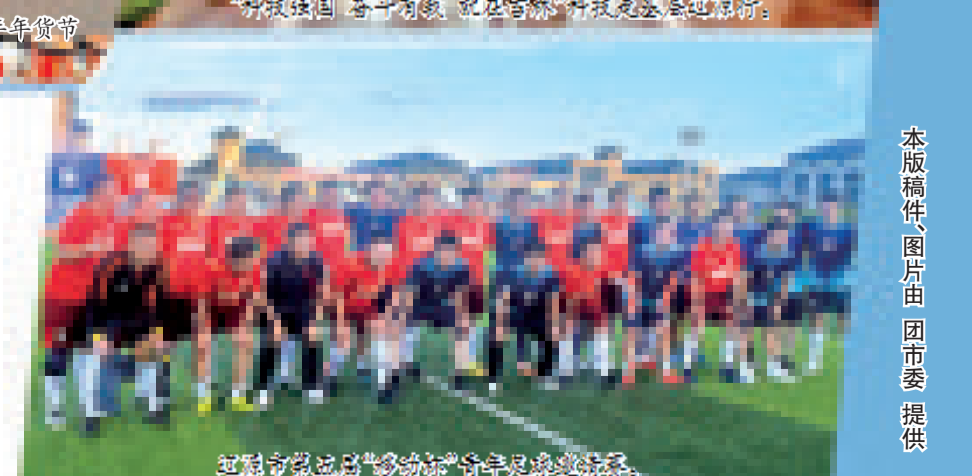
辽源市第二届“多动能”青年足球邀请赛。