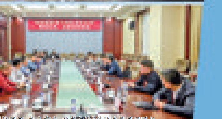
“科技强国 奋斗有我 就在吉林”科技走基层辽源行。