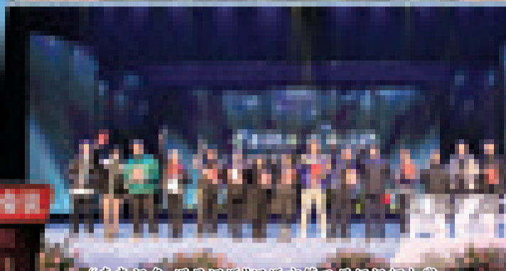
“青春视角·遇见辽源”辽源市第三届短视频大赛。