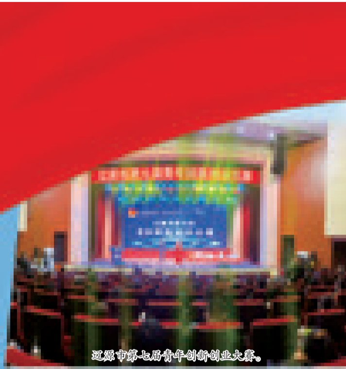
辽源市第七届青年创新创业大赛。

时代的责任赋予青年,时代的光荣属于青年。未来五年,是辽源转型发展、全面振兴的重要历史关口,辽源正处在夯实发展基础、增强发展活力、提升发展质量的关键历史阶段。壮丽的事业召唤着新时代辽源青年率先突破,崇高的使命激励着辽源共青团继续往开来。作为党领导的先进青年的群众组织,今后五年,辽源共青团将高举习近平新时代中国特色社会主义思想伟大旗帜,与党同心、跟党奋斗,踔厉奋发、勇毅前行,团结带领广大团员青年牢记嘱托、挺膺担当,为辽源创新转型发展、为实现中华民族伟大复兴的中国梦,谱写无愧于时代的青春华章!