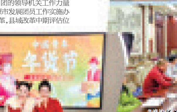
“青春联手·助力振兴”第三届青年年货节直播现场。