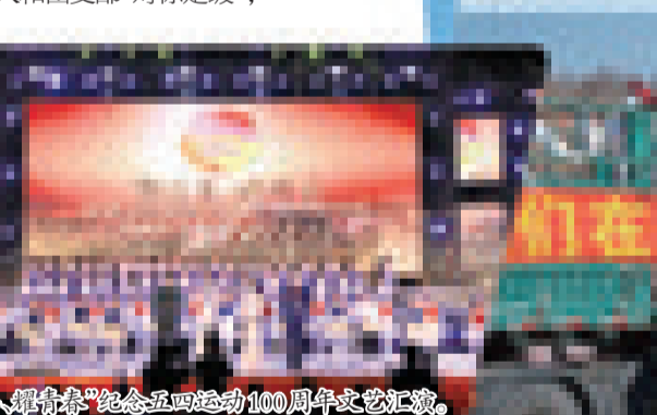
“新青年·耀青春”纪念五四运动100周年文艺汇演。