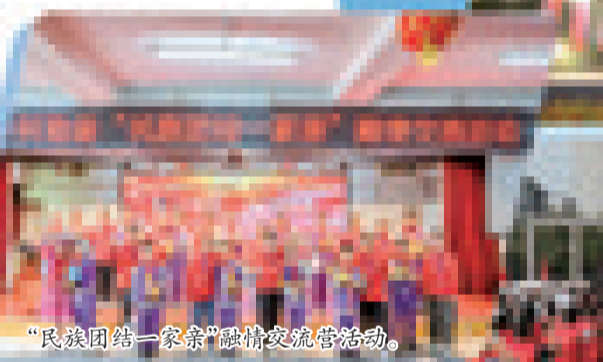
“民族团结一家亲”融情交流营活动。