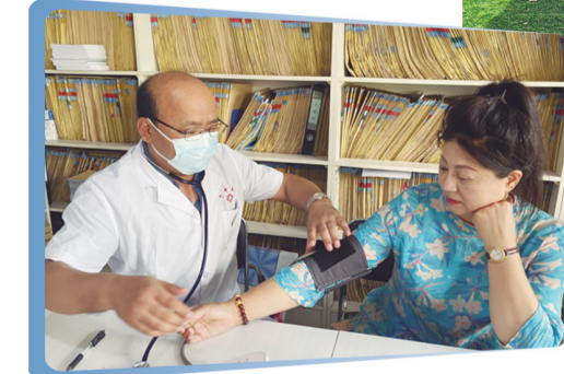
▲截至目前,东丰县已下派医护人员392人次到乡(镇)开展巡回医疗活动,为基层群众提供健康医疗服务。