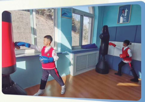
▲心理辅导室装备齐全,为帮助学生调整身心健康提供良好条件。