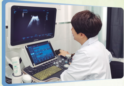
▲东辽县持续推进农村地区“两癌”筛查工作,全力保障全县妇女健康。