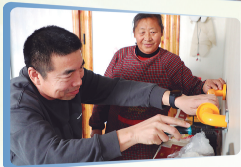
▲东辽县积极打造老年宜居环境,入户为老人安装无障碍设施。