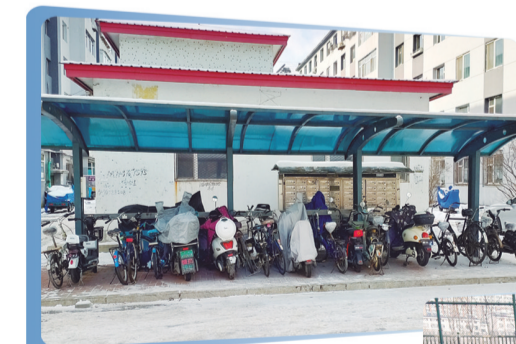
▲居民小区充电桩建设缓解了电动车充电难问题。

则。适老化改造工作由特殊困难老年人及其监护人、家庭成员自愿申请,相关部门进行登记造册,根据特殊困难老年人身体状况、住宅实际等特点,以2000元/户的标准制定改造方案,经特殊困难老年人及其家庭成员同意后实施。 严格控制改造质量。在改造时,充分考虑老年人家庭住房条件与安全性,做到文明改造,不影响老年人正常生活。同时严把产品质量关,做到质量合格、使用安全。截至目前,东辽县已为90户特困老年人家庭进行适老化改造,包括为行动不便的老年人配备轮椅、电饭锅、电磁炉、血压仪、理疗灯共计400余件;为行动不便的老年人安装安全扶手,配备护理床,为使用煤气的家庭安装燃气报警装置等。