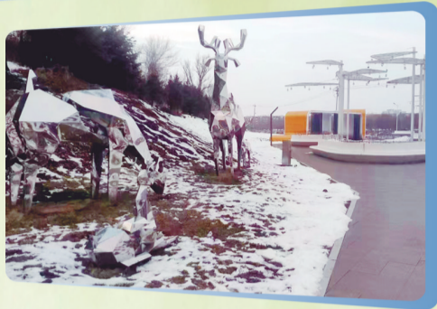
▲南照山风景区形成闭环景观带,构成区域综合休闲空间。