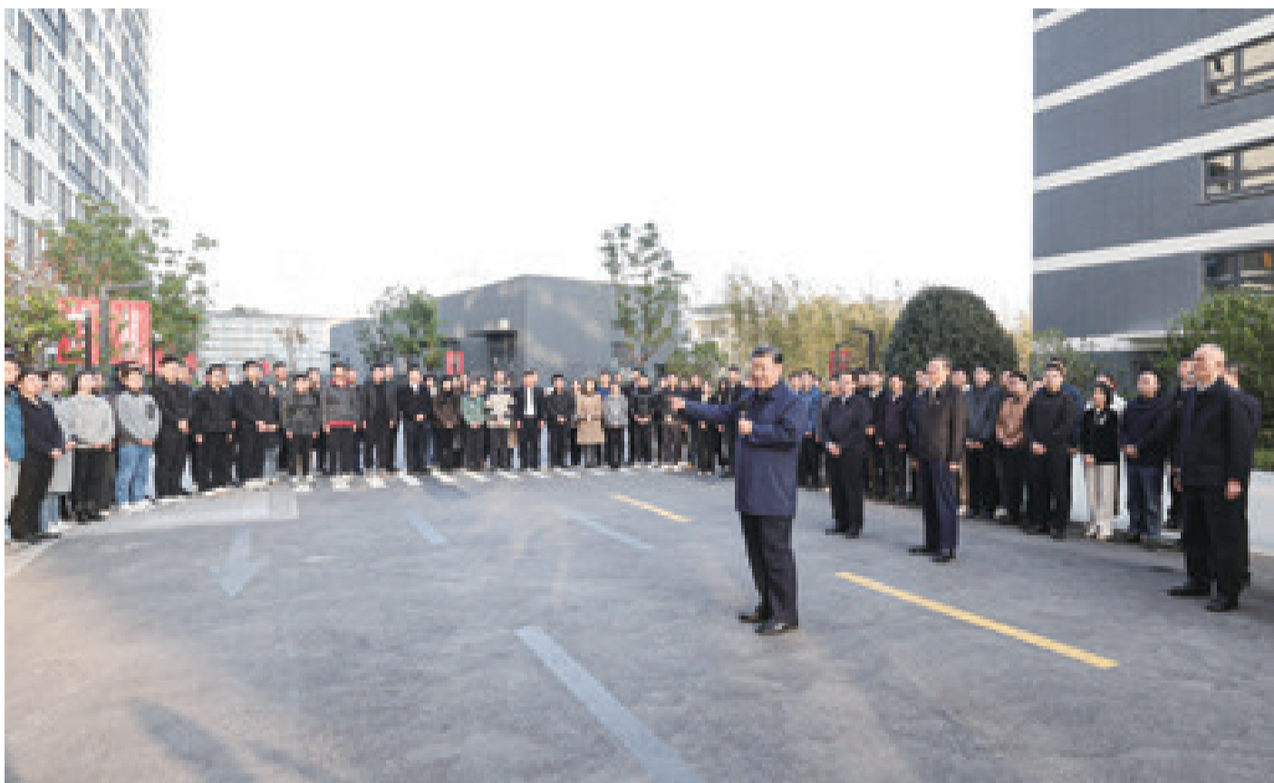
11月28日至12月2日,中共中央总书记、国家主席、中央军委主席习近平在上海考察。这是11月29日下午,习近平在闵行区新时代城市建设者管理者之家,同社区居民亲切交流。

新华社上海/江苏盐城12月3日电 中共中央总书记、国家主席、中央军委主席习近平近日在上海考察时强调,上海要完整、准确、全面贯彻新发展理念,围绕推动高质量发展、构建新发展格局,聚焦建设国际经济中心、金融中心、贸易中心、航运中心、科技创新中心的重要使命,以科技创新为引领,以改革开放为动力,以国家重大战略为牵引,以城市治理现代化为保障,勇于开拓、积极作为,加快建成具有世界影响力的社会主义现代化国际大都市,在推进中国式现代化中充分发挥龙头带动和示范引领作用。