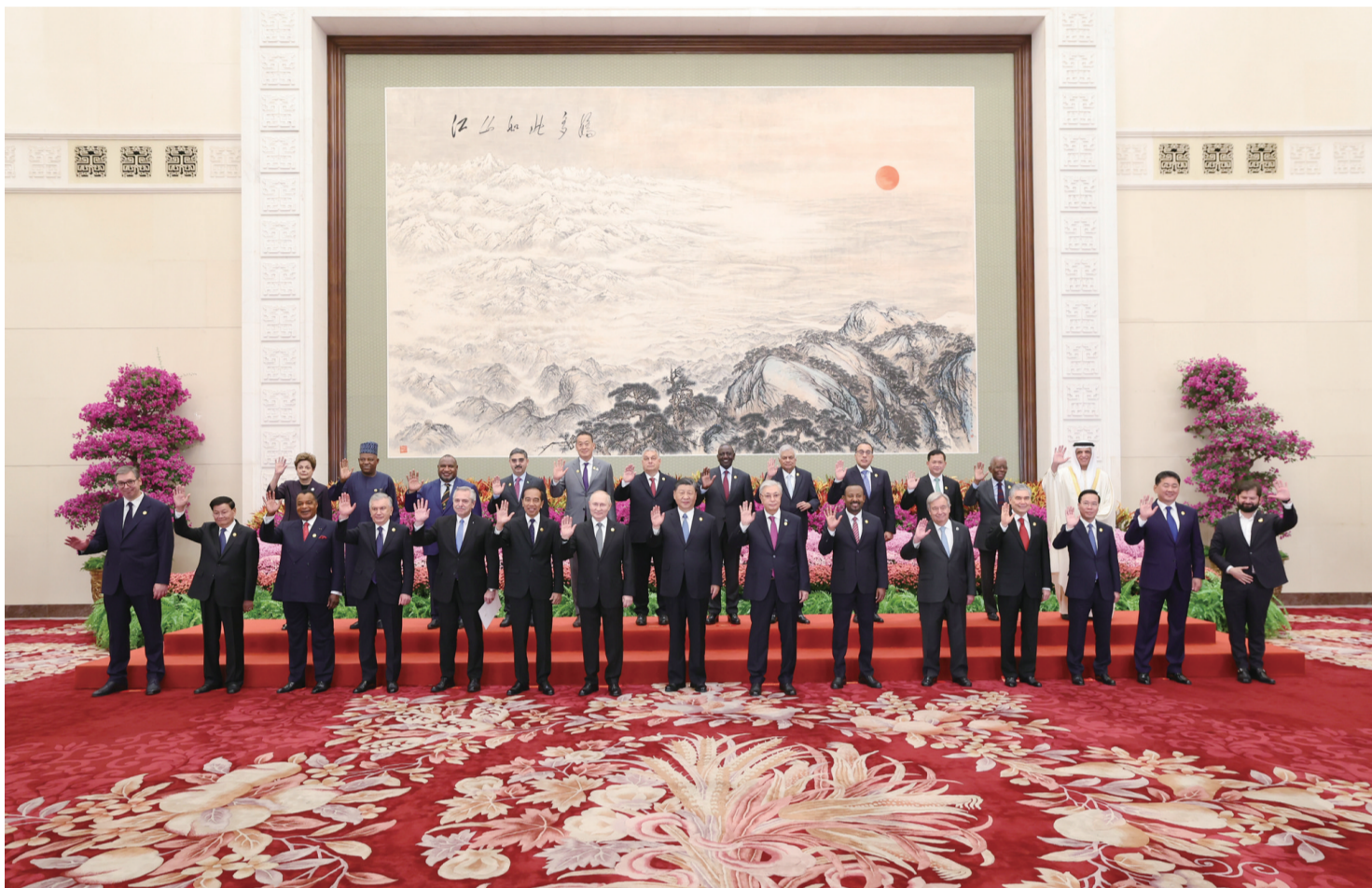
10月18日上午,国家主席习近平在北京人民大会堂出席第三届“一带一路”国际合作高峰论坛开幕式并发表题为《建设开放包容、互联互通、共同发展的世界》的主旨演讲。这是会前,习近平同出席高峰论坛的外国国家元首、政府首脑和国际组织负责人等国际贵宾集体合影。