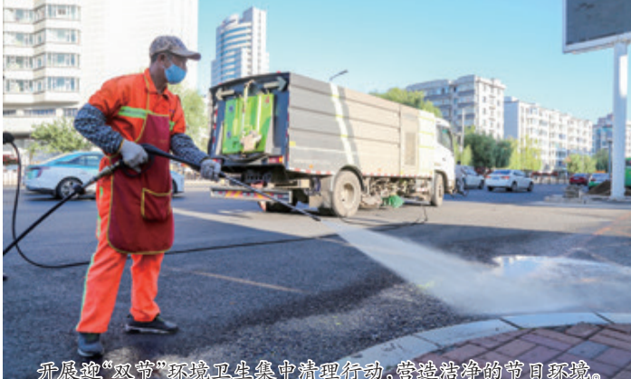
开展迎“双节”环境卫生集中清理行动,营造整洁的节日环境。