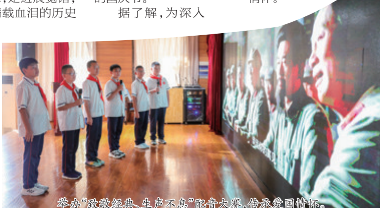
举办“致敬经典、声生不息”配音大赛,传承爱国情怀。