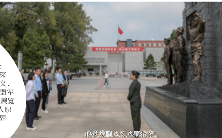
接受爱国主义主题教育。