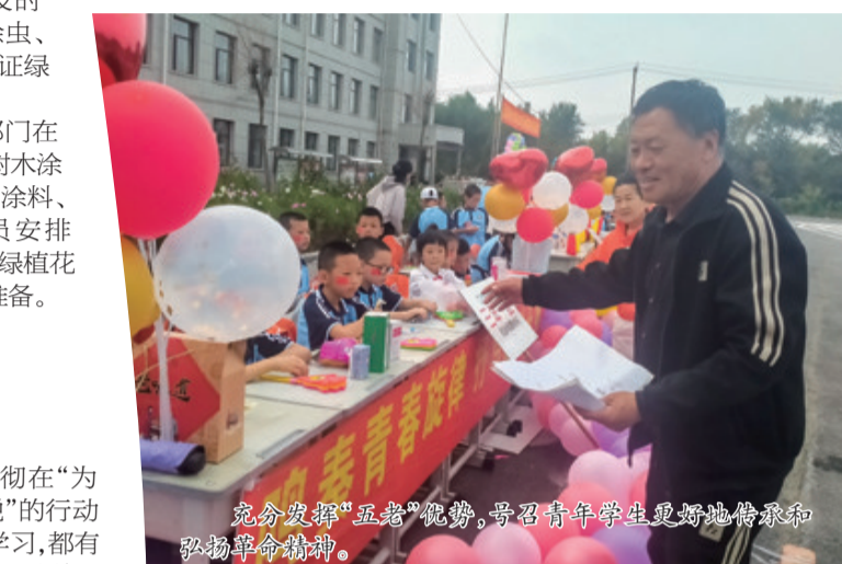
充分发挥“五老”优势,号召青年学生更好地传承和弘扬革命精神。