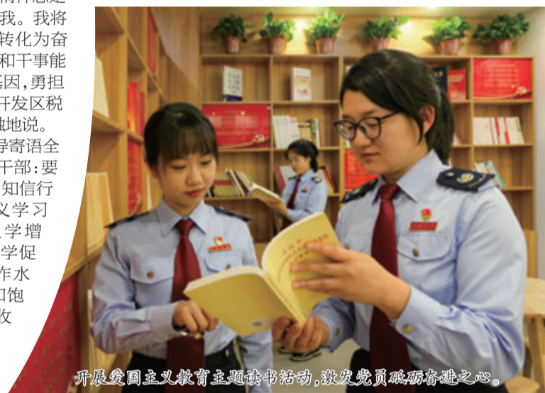
开展爱国主义主题读书活动,激发党员砥砺奋进之心。