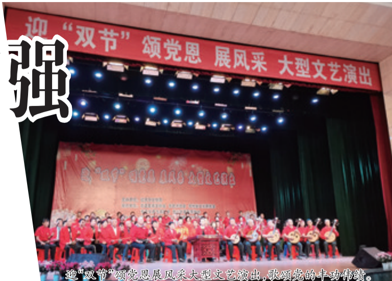
迎“双节”颂党恩展风采大型文艺演出,歌颂党的丰功伟绩。