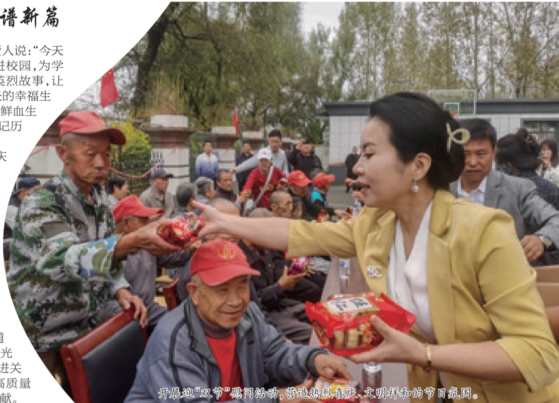
开展迎“双节”慰问活动,营造热烈喜庆、文明祥和的节日氛围。