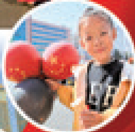
小朋友手持着印有五星红旗图案的各类纪念品。