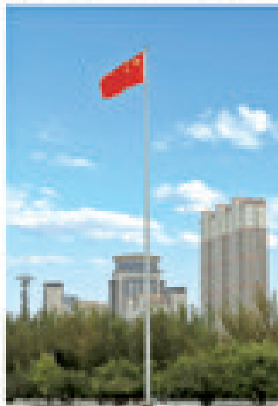
“十一”期间,人民广场上鲜艳的五星红旗高高飘扬。

国庆节和中秋节期间,辽源这座城市充满了喜庆的节日氛围。道路两侧的路灯杆上,一面面鲜红的五星红旗迎风飘扬;大小商超内,鲜红的小型国旗等国庆元素吸引着众人的目光;公园广场沿河景观及路边,各类庆祝国庆、中秋“双节”的鲜花绿植及立体花摆,为广大市民打造了节日美景;夜晚的斜拉桥、东山体育公园和茵特拉根广场等处,汇聚着众多市民驻足欣赏闪耀在城市夜空的烟花秀、灯光秀……广大辽源市民及外来人员充分感受到了节日的欢乐祥和氛围。 “双节”期间,辽源市区内最热闹的地方当属悦动辽源欢乐荟和东山体育公园超级碗体育场内。这里不仅各类表演活动和赛事精彩纷呈,更有许多特色美食和有趣的小商品。尤其 到了夜晚,这里就变成了欢乐的海洋:儿童娱乐区孩子们的笑声在空中回响,舞台表演带动着观众的喜悦情绪。空气里飘散着各类美食的香味。群众自发组织的社团、音乐爱好者们一展歌喉,美丽的舞者穿着传统服饰在月下翩翩起舞,向游客尽情展现辽源人的热情。 国庆期间,辽源“四馆”迎来了许多学生和家