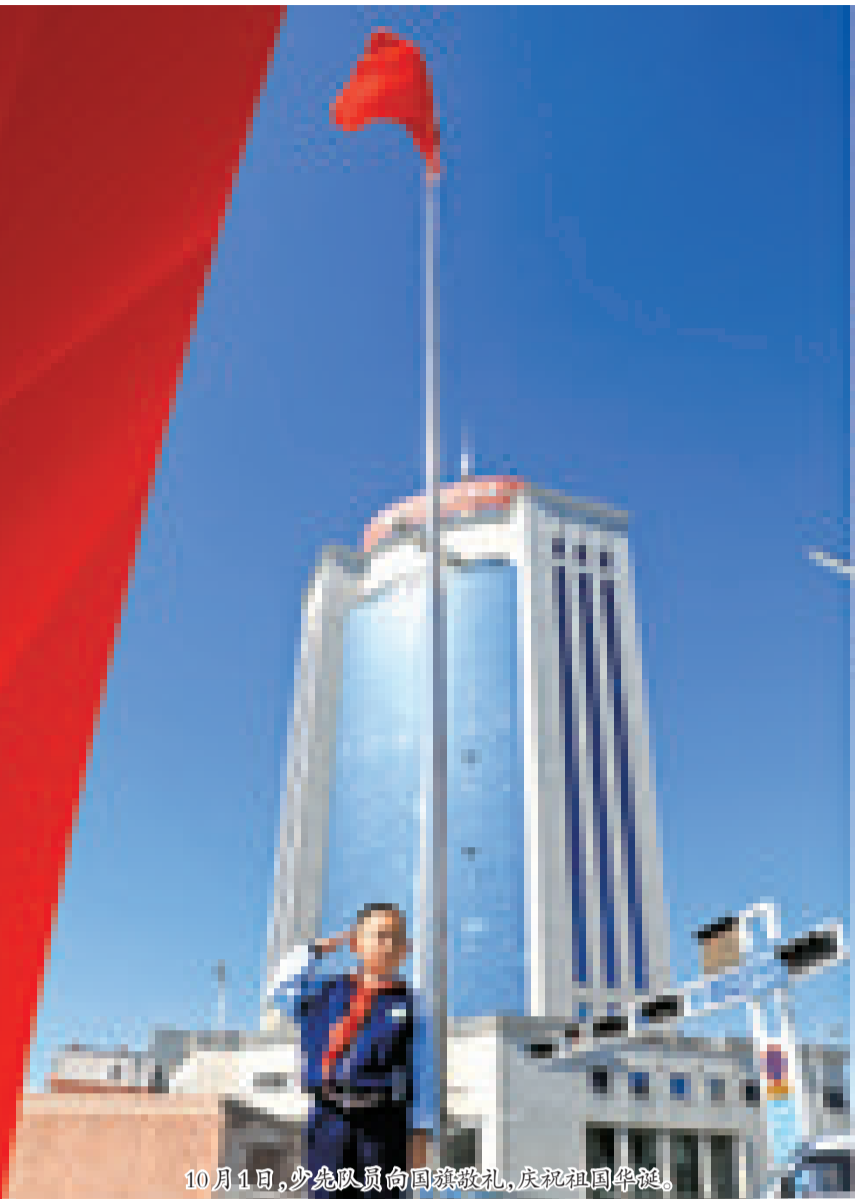
10月1日,少先队员向国旗敬礼,庆祝祖国华诞。