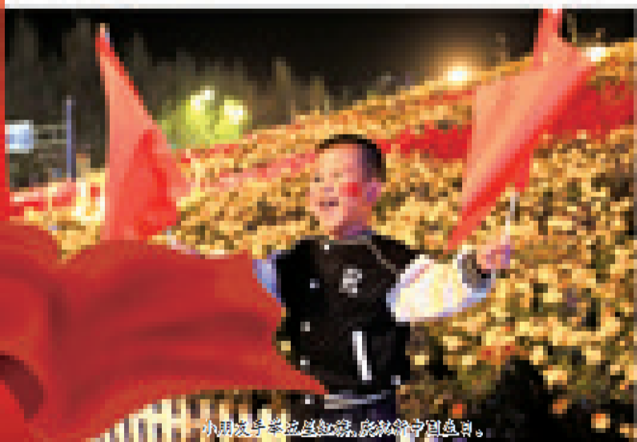
小朋友手持五星红旗,庆祝祖国生日。