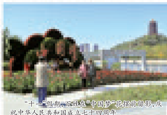
“十一”假期,百姓在“中国梦”花摆前留影,庆祝中华人民共和国成立七十四周年。