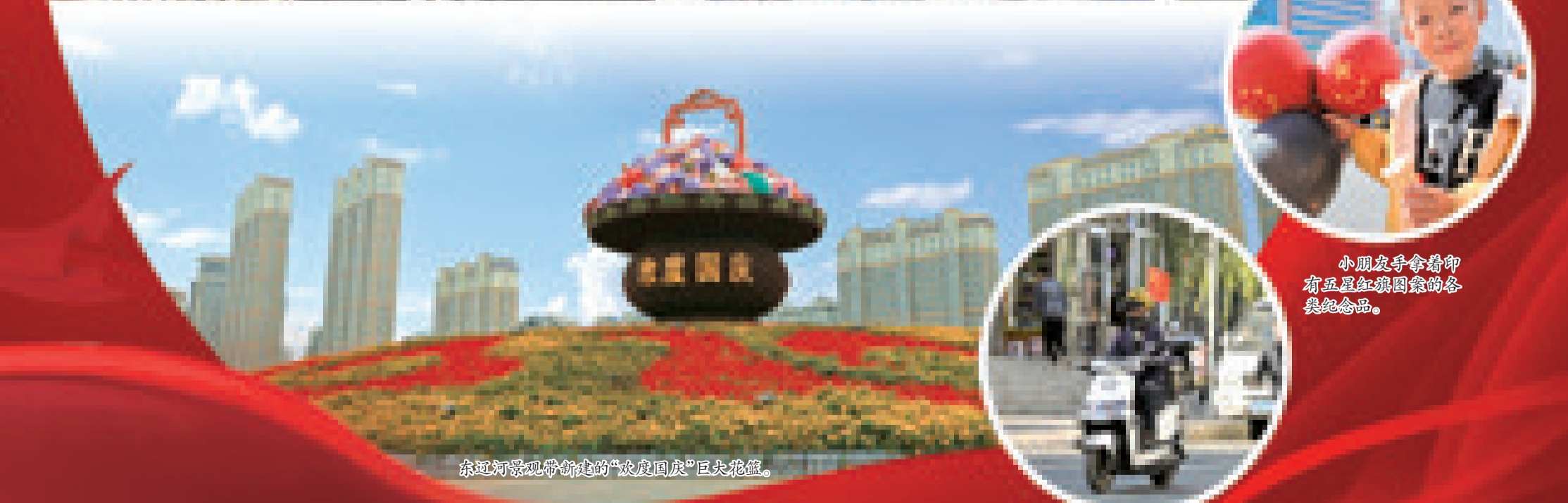
东辽河景观带新建的“欢度国庆”巨大花摆。