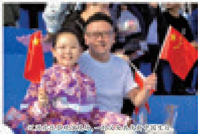
辽源欢乐荟观演现场,一对父女共庆新中国生日。