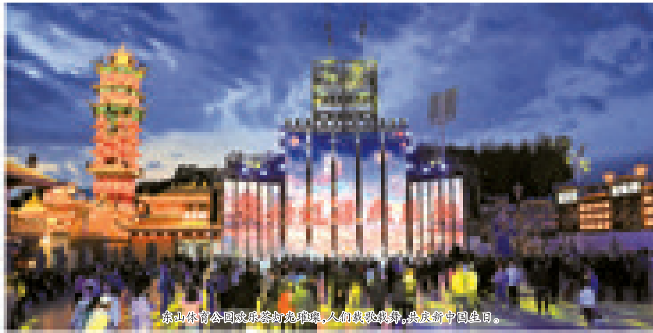
东山体育公园欢乐荟灯光璀璨,人们载歌载舞,共庆新中国生日。

国庆节和中秋节期间,辽源这座城市充满了喜庆的节日氛围。道路两侧的路灯杆上,一面面鲜红的五星红旗迎风飘扬;大小商超内,鲜红的小型国旗等国庆元素吸引着众人的目光;公园广场沿河景观及路边,各类庆祝国庆、中秋“双节”的鲜花绿植及立体花摆,为广大市民打造了节日美景;夜晚的斜拉桥、东山体育公园和茵特拉根广场等处,汇聚着众多市民驻足欣赏闪耀在城市夜空的烟花秀、灯光秀……广大辽源市民及外来人员充分感受到了节日的欢乐祥和氛围。 “双节”期间,辽源市区内最热闹的地方当属悦动辽源欢乐荟和东山体育公园超级碗体育场内。这里不仅各类表演活动和赛事精彩纷呈,更有许多特色美食和有趣的小商品。尤其 到了夜晚,这里就变成了欢乐的海洋:儿童娱乐区孩子们的笑声在空中回响,舞台表演带动着观众的喜悦情绪。空气里飘散着各类美食的香味。群众自发组织的社团、音乐爱好者们一展歌喉,美丽的舞者穿着传统服饰在月下翩翩起舞,向游客尽情展现辽源人的热情。 国庆期间,辽源“四馆”迎来了许多学生和家