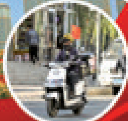
节日期间,快递小哥的车上插上了国旗。