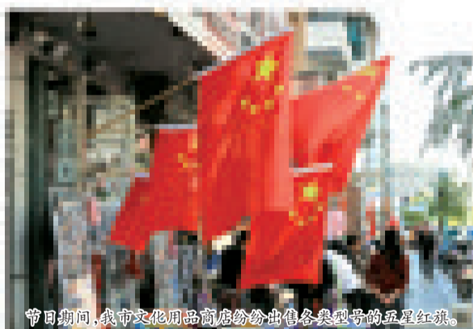
节日期间,我市文化用品商店纷纷出售各类型号的五星红旗。