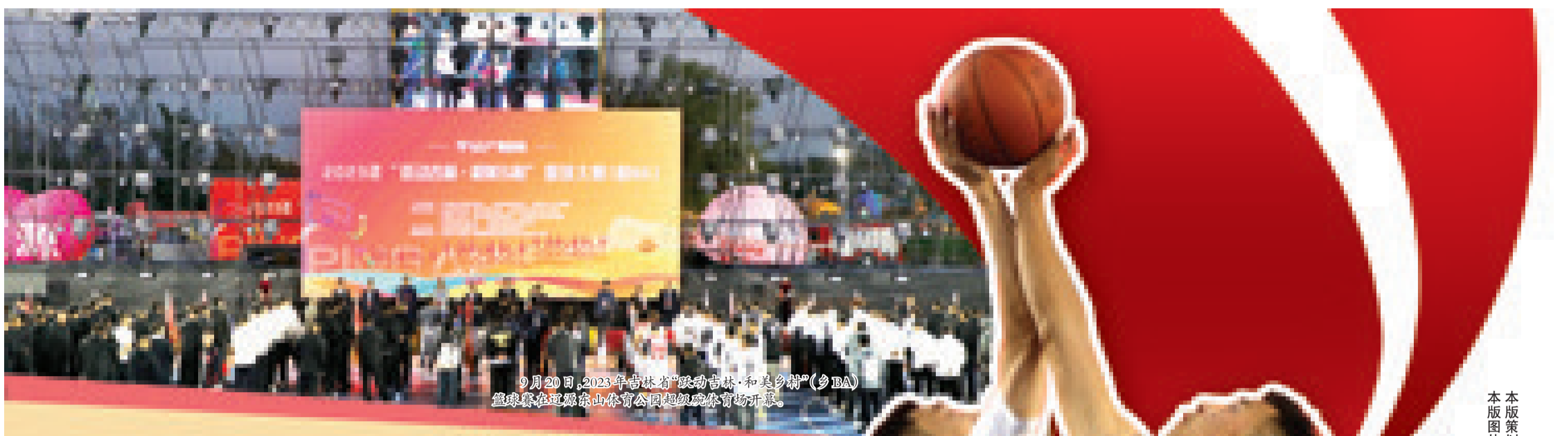
9月20日,2023年吉林省“跃动吉林·和美乡村”(乡BA)篮球赛在辽源东山体育公园超级碗体育场开幕。