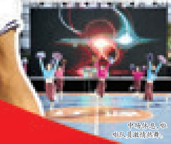
中场休息,啦啦队员激情热舞。