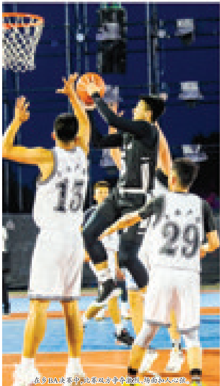
在乡BA决赛中,比赛双方争夺激烈,场面扣人心弦。