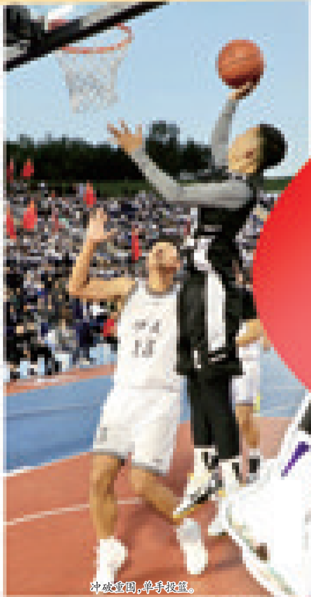
冲破重围,单手投篮。

体运动员、裁判员大力弘扬体育精神,赛出成绩、赛出风格、赛出水平、赛出友谊,他们在篮球场上挥洒汗水、奋勇拼搏,呈现了一场场精彩的篮球比赛。此次“跃动吉林·和美乡村”篮球赛是我省近年来举办的最具吉林乡村特色的综合性农民体育品牌赛事,不仅是丰富人民群众精神文化生活的有力举措,更是展示新时代农民风采、助力乡村振兴的生动实践。 近年来,辽源市委、市政府高度重视体育事业发展,深入实施全民健身国家战略,把开展群众性体育活动作为提升人民群众身心健康水平的重要抓手,作为推进中国式现代化建设的重要内容,通过体育牵引、文化赋能、旅游带动,持续做深“体育+”文章,逐步形成“文、体、旅、商”深度融合的发展模式。本次篮球赛进一步加强了区域间体育文化交流,激发了广大农民群众参与热情,以更加健康的体魄、更加昂扬的斗志、更加奋发的状态,在加快建设宜居宜业和美乡村、实现新时代东北全面振兴的新征程上再创佳绩、再立新功。