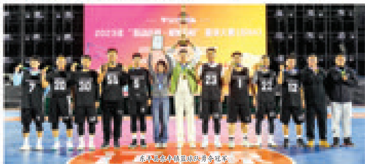
东丰县东丰镇篮球队勇夺冠军。