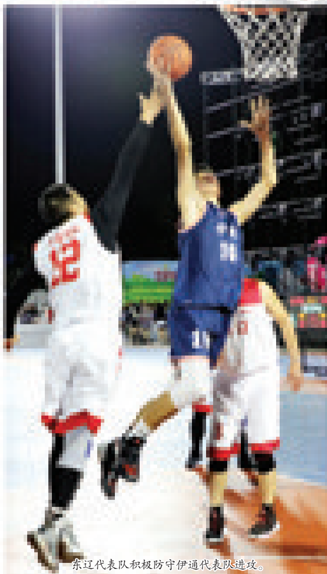
东辽代表队积极防守伊通代表队进攻。