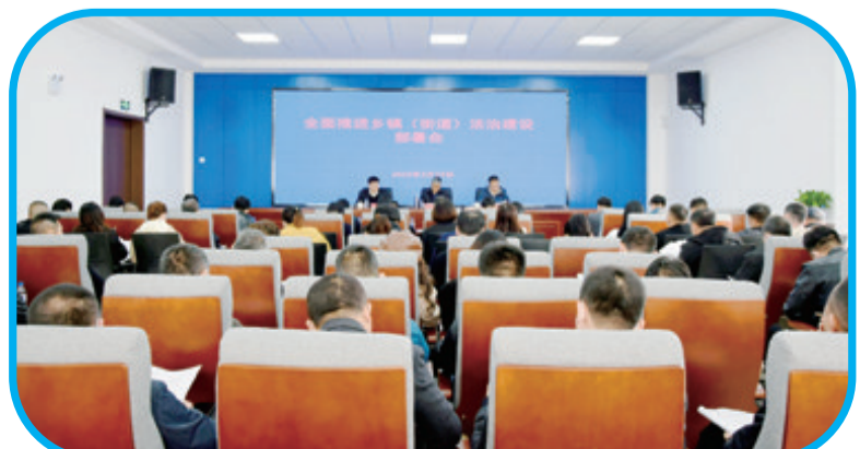
召开全面推进乡(镇、街道)法治建设部署会。