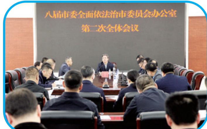
4月14日,召开八届市委全面依法治市委员会办公室第二次全体会议。

截至6月底,市公安局受理企业报警求助30余件,全部得到妥善处置,为企业办理证照867件。市检察院共办理行政检察监督案件144件,行政违法行为监督案件39件,行政争议实质性化解案件129件,涉企行政处罚案件23件。市中院共审查登记立案653件,接听12368热线1300余次,辽源地区网上立案总数3379件。市工商联依法推进我市涉案企业合规改革试点工作,与辽源市人民检察院、辽源市司法局等10家单位召开联席会议,努力营造安商惠企法治化营商环境。