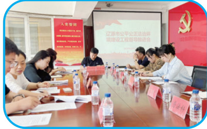
辽源市公平法治化营商环境建设推进推进会现场。

将合法性审查纳入市政府常务会议前置程序。拓宽合法性审查覆盖面,明确要求凡是常务会议讨论议题,必需履行合法性审查程序,切实做到应审必审、依法合规。建立了合法性审查提前介入机制,打破传统的履行完相应程序方可提请合法性审查的形式,使法律服务更精准、更高效。成立“专家团式”审核小组,市委、市政府联合聘任我市知名度较高、具有社会担当和责任感的22名律师作为政府法律顾问,加强重大行政决策合法性审查力量。在重大复杂疑难的决策事项面前,广泛听取专家意见,提升合法性审查质量。