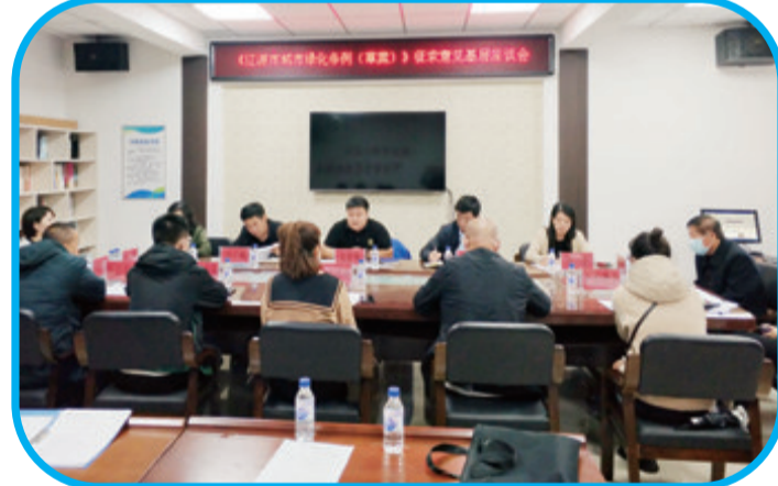
召开《辽源市城市绿化条例(草案)》征求意见基层座谈会。

县(区)是法治镇街建设的主体。在市委依法治市办的强力推动下,各县(区)分别立足“杨木林镇、安恕镇、北寿街道、太安街道”4个先行先试点,强化担当,主动作为,以点带面、辐射带动,并带动全市各乡(镇)全面推开法治建设工作。目前,两县两区均制定了《关于全面推进法治建设的实施方案》,下发了工作指引,全部乡(镇、街道)均已成立了依法治镇委员会或领导小组,切实呈现出“全面深化、亮点频出、创新发展”的良好局面。