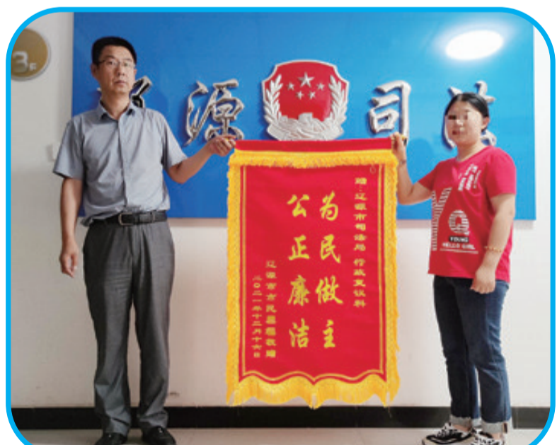
办事群众为市司法局行政复议科送来表扬其“为民做主、公正廉洁”的锦旗。

自2021年7月行政复议体制改革以来,市本级行政复议机构共办理行政复议案件229件,以确认违法、撤销、变更、责令履行等方式直接纠错13件,以调解、和解等方式化解行政争议65起,行政复议化解行政争议的力度和效果显著增强,“公正高效”“便民为民”正成为辽源复议的画像与标签。