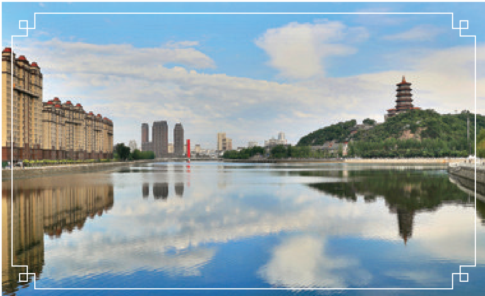
东辽河两岸风景优美,是人们茶余饭后休闲纳凉的好去处。