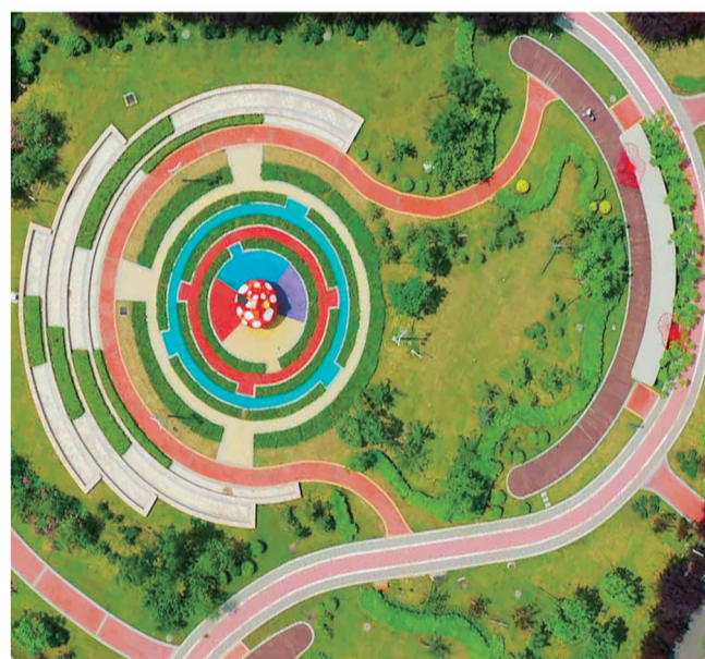
西安公园内花团锦簇、绿树成荫。