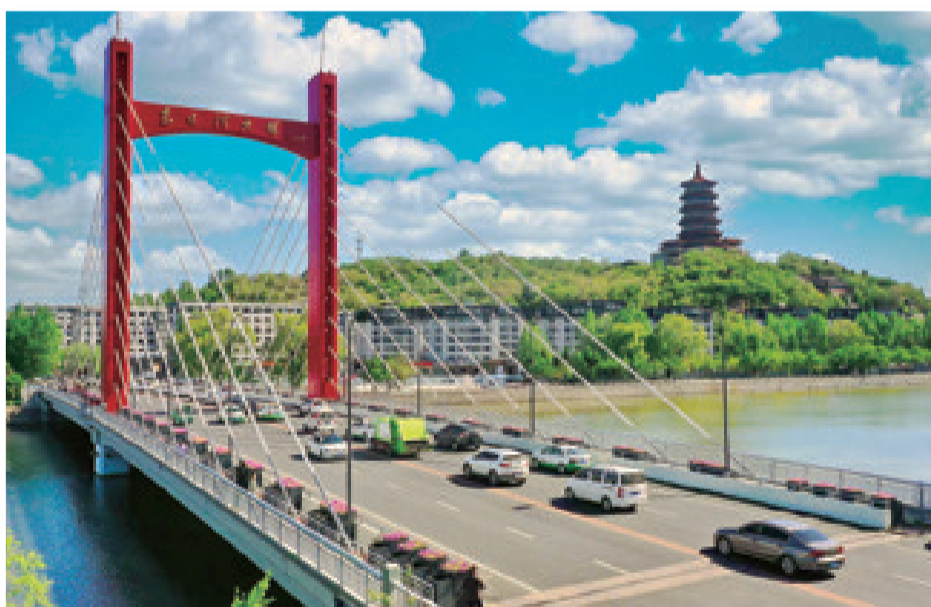
风光旖旎的龙首山和斜拉桥景观成为我市一道靓丽的风景。