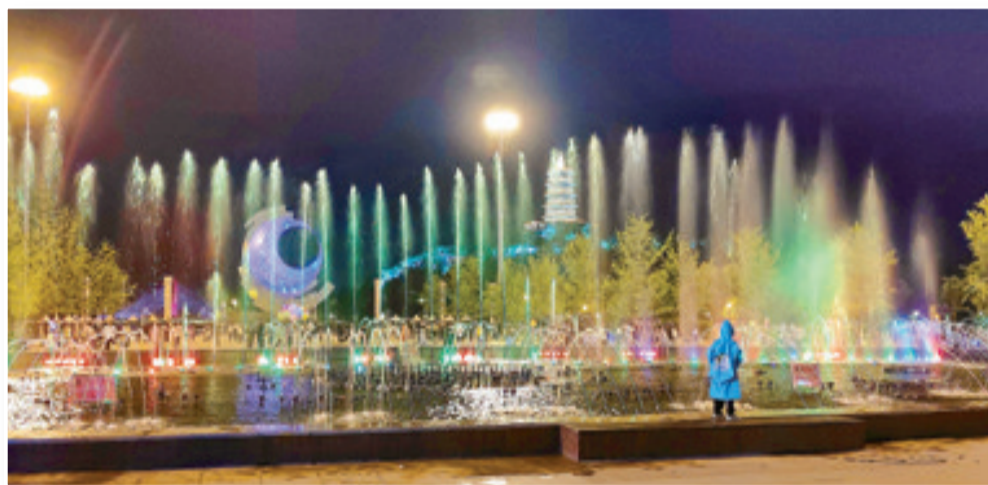
辽河半岛广场喷水池内的五彩水柱吸引了众多市民来此观看和嬉戏。