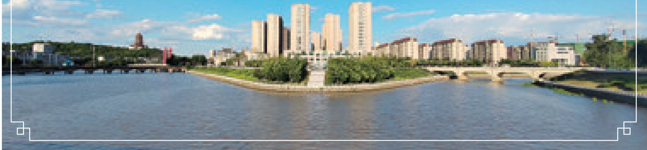
近年来,我市加强生态文明建设,让辽源的天更蓝、山更绿、水更清、环境更优美,人民群众的获得感、幸福感、安全感不断提升。图片摄于东辽河与梨树河交汇处。