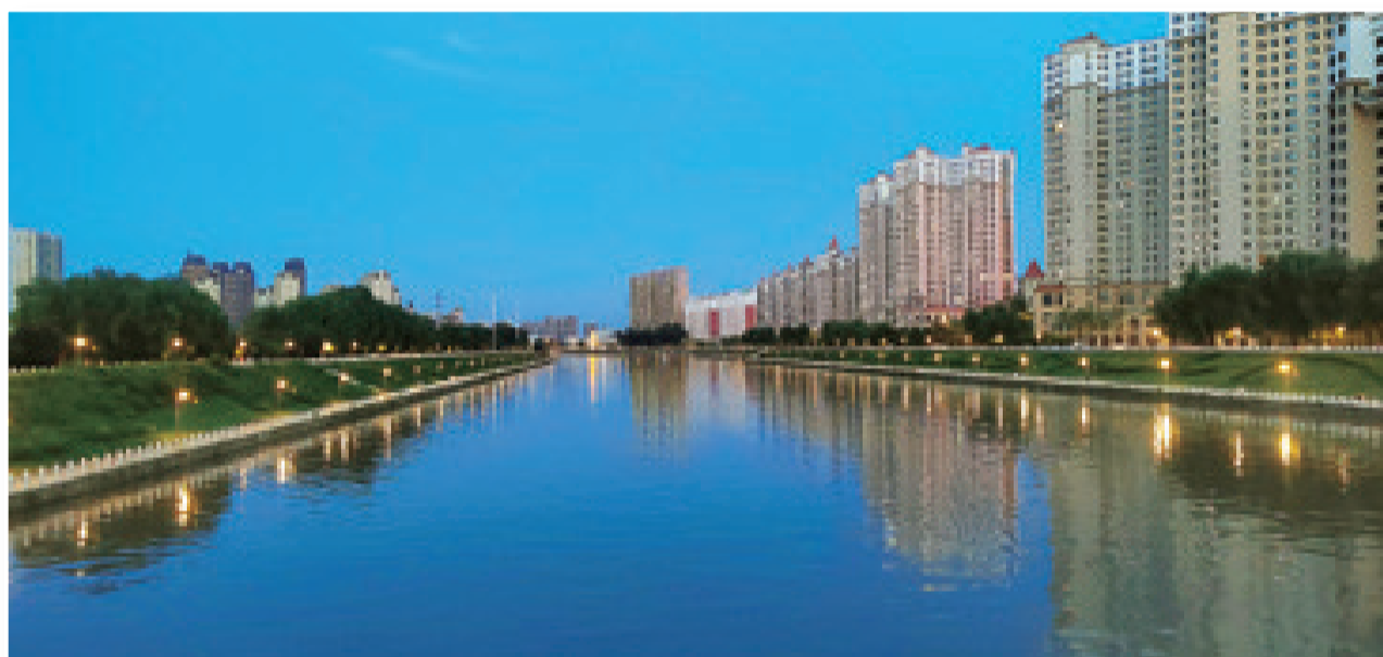
我市全力做好东辽河沿岸生态环境整治工作,现在的东辽河水清岸绿,风景如画。