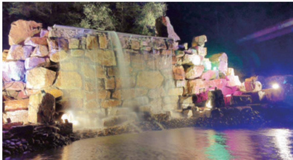
东山公园新建的瀑布景观又给游客增添了一处打卡地。