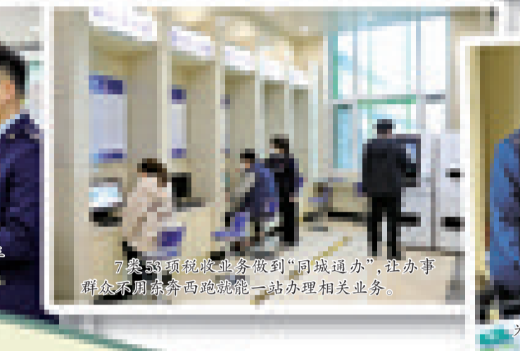
7类53项税收业务做到“同城通办”,让办事 群众不用东奔西跑就能一站办理相关业务。