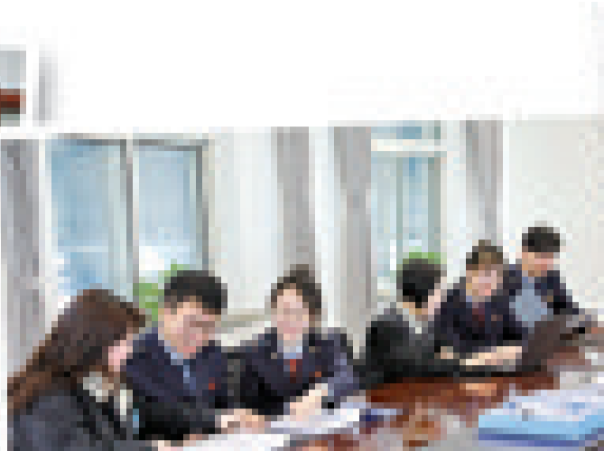
精心打造“税务助企发展服务团”,助力企业健康发展。