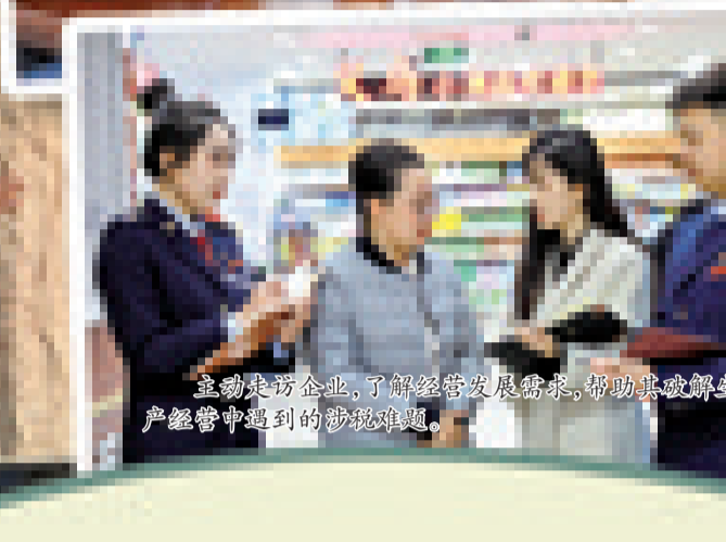
主动走访企业,了解经营发展需求,帮助其破解生 产经营中遇到的涉税难题。