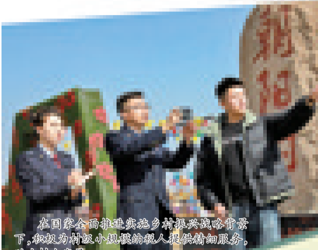
在国家全面推进实施乡村振兴战略背景下,积极为村级小微企业纳税人提供精细服务,助力村企发展。