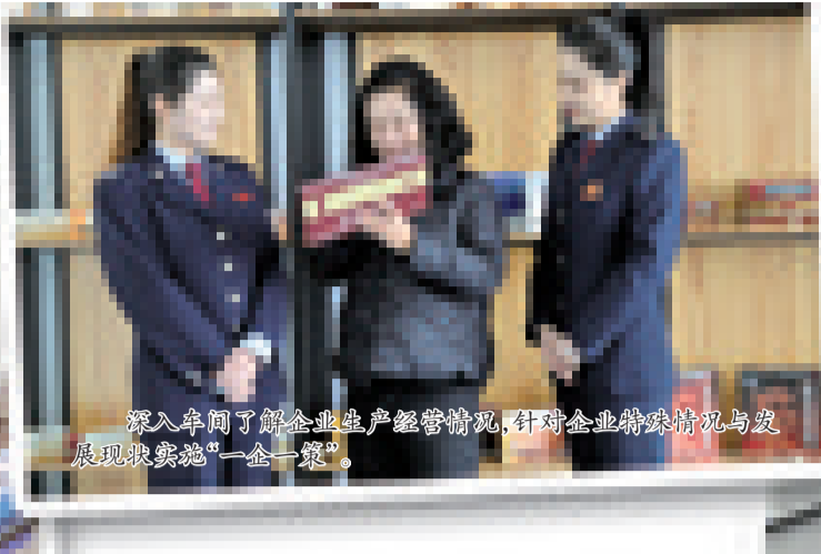
深入车间了解企业生产经营情况,针对企业特殊情况与发 展现状实施“一企一策”。