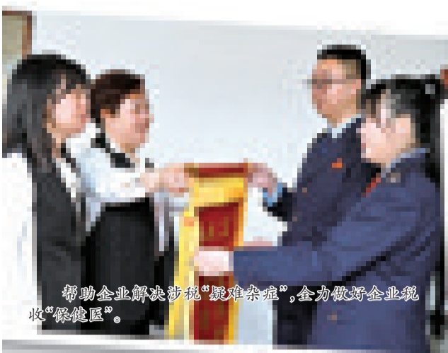
帮助企业解决涉税“疑难杂症”,全力做好企业税收“保健医”。