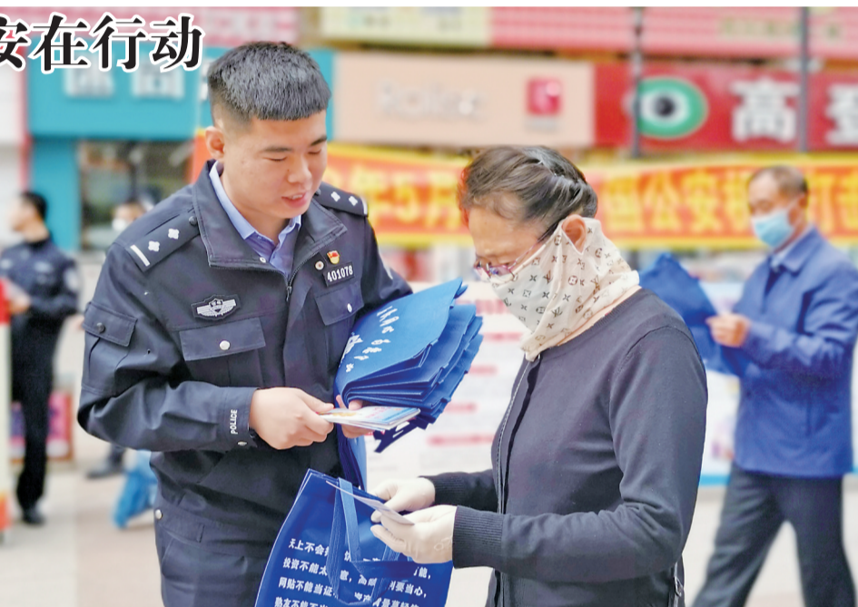
民警向群众发放宣传手册,讲解如何识别非法集资、传销、银行卡盗刷、假币等经济犯罪行为。

“非法集资都有哪些类型和手段”“老年人如何防范非法集资陷阱”……活动现场,民警们通过发放宣传手册、摆放宣传展板等方式向市民群众宣传打击和防范经济犯罪知识。同时,民警结合非法集资、传销、养老诈骗等经济犯罪,以及假币、假发票等民生型经济犯罪的特点、危害性、表现形式,采取以案说法的形式深刻揭露非法集资、传销、银行卡盗刷、假币等经济犯罪的真面目,以此提高广大人民群众识别假防骗的能力,充分调动广大人民群众参与防范和打击经济犯罪工作的积极性、主动性。