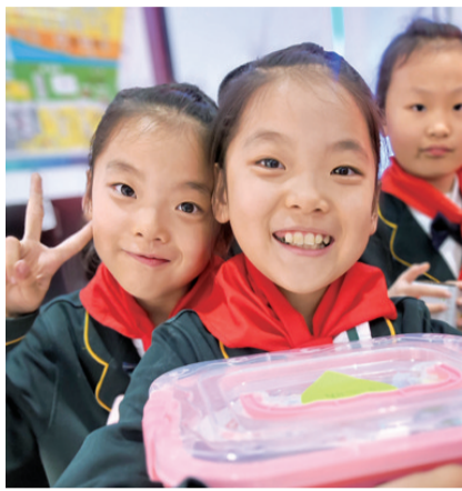
福镇社区开展“点亮‘微心愿’、助力大梦想”志愿服务启航圆梦活动,努力让孩子们幸福快乐地成长。

把党的温暖送到老百姓心坎上,实现在职党员深入群众、服务群众、帮扶弱势群体示范引领作用。 福镇社区启动“点亮‘微心愿’、助力大梦想”党员志愿服务活动后,与福镇路小学取得联系,面向困难学生征集“微心愿”,由老师根据学生实际困难情况指导其填写“心愿卡”。社区对征集的“微心愿”进行整理、核查、分类、汇总后进行公示和发布,并号召党员干部、报到的党组织、在职党员本着立足实际、力所能及原则,自愿认领“微心愿”,并积极完成“微心愿”。