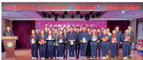
东吉街道东吉社区联合区税务局、区住建局、多寿路小学、辖区在职党员开展“关爱未成年人‘微爱筑梦’暨‘缅怀英烈、振兴中华’爱国主义宣讲活动,培养青少年爱国情怀。