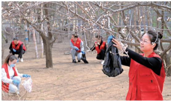
东辽县白泉镇新城社区积极开展党员志愿服务活动,提升居民生活环境质量。

共同开展“文明‘创城’、党员先行”在职党员进社区志愿服务活动。下一步,新城社区将进一步加大督促和宣传力度,引导居民群众树立文明观念、争当文明市民,展示文明形象,不断提高居民群众参与创建、配合创建、共同创建的热情,确保“创城”工作任务落实到位,不断巩固扩大文明城市创建成果。