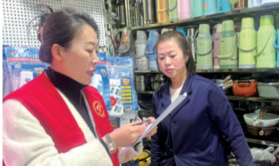
西宁社区通过“契约化”共建模式,实现资源互补、服务共享,不断提升居民幸福指数。

则,由社区党委通过“进夜访民情”“敲门行动”等活动,积极深入社区群众中开展调研,收集社情民意。同时,深化“专业的事情专业的人干”理念,指导报到的党员根据自身职责和资源优势提出服务内容及方式,形成资源清单和可服务清单。结合征求到的需求和现有资源,形成“三张清单”,组建社会治理、义诊帮扶、环境卫生整治、困难帮扶、政策宣讲、活动组织策划等6支服务队。 “双报到”活动的开展加强了社区党组织和各单位之间的互联互通,推动了党建工作的共建共促。接下来,西宁社区党委将继续发挥党组织的核心作用,全面整合辖区各类资源,探索形式多样的共驻共建活动,实现“资源共享、优势互补、共驻共建、共同发展”的基层治理新格局,为群众办实事、解难题,不断强化为民服务功能。