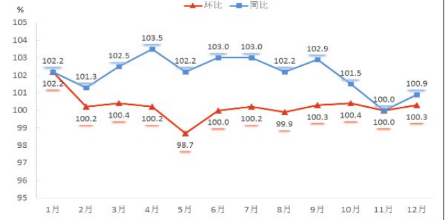
表1 2022年全市居民消费价格指数