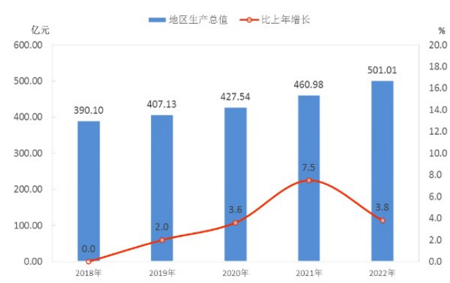
图1 2018—2022年地区生产总值及其增长速度

年末全市户籍总人口为113.14万人,按户口所在地划分,全市城镇人口为56.03万人,乡村人口为57.11万人。