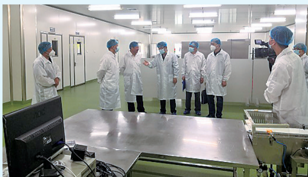
市市场监管局相关负责人陪同省专家服务团实地走访对接国家级知识产权优势企业博大信业，进行现场指导服务。