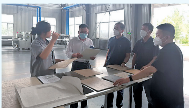
市市场监管局相关负责人陪同省专家服务团实地走访对接国家级知识产权优势企业华纺静电科技，进行现场指导服务。