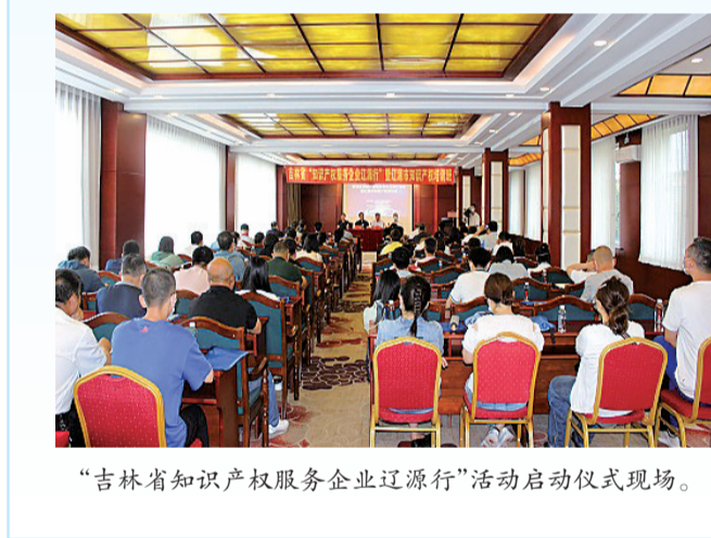
“吉林省知识产权服务企业辽源行”活动启动仪式现场。