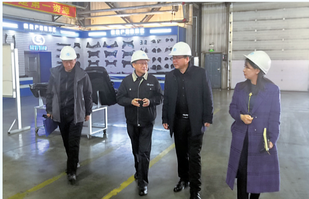
市市场监管局知识产权调研组深入国家级知识产权示范企业格致汽车科技调研指导服务。