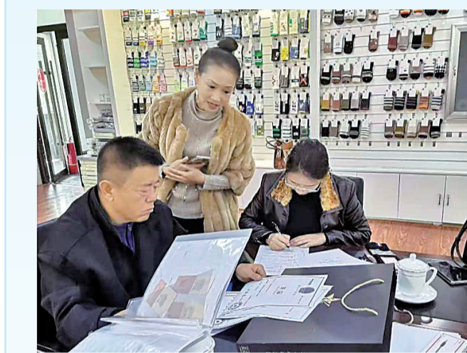
市市场监管局执法人员深入企业开展现场检查、指导服务。