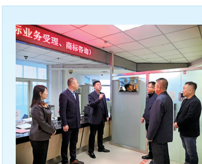
国家知识产权局商标业务辽源受理窗口正式挂牌。

申请主体备案流程： 1. 在吉林省知识产权运用服务平台 ( http://jilin.sino-web.cn ) 首次登录的用户，点击“一窗预审”，选择“预审管理平台预审案件提交系统”，进入后选择“申请主体”下“申请主体用户注册”进行注册，按要求如实填写相关信息并提交，提交后等待吉林省知识产权保护中心审核； 2. 注册成功并登录后点击“备