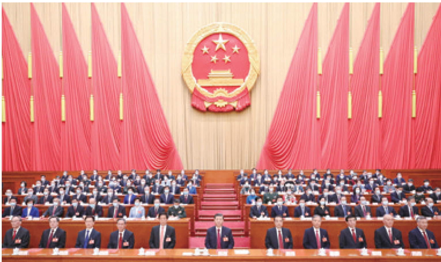
3月13日,第十四届全国人民代表大会第一次会议在北京人民大会堂闭幕。中共中央总书记、国家主席、中央军委主席习近平发表重要讲话。