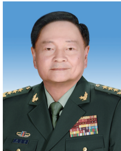
中华人民共和国中央军事委员会副主席 张又侠