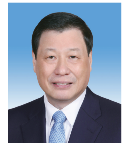
最高人民检察院检察长 应勇

张军,男,汉族,1956年10月生,山东博兴人,1973年1月参加工作,1974年5月加入中国共产党,中国人民大学法律系刑法专业毕业,研究生学历,法学博士学位。 现任中共二十届中央委员,最高人民法院院长、党组书记、审判委员会委员,首席大法官。