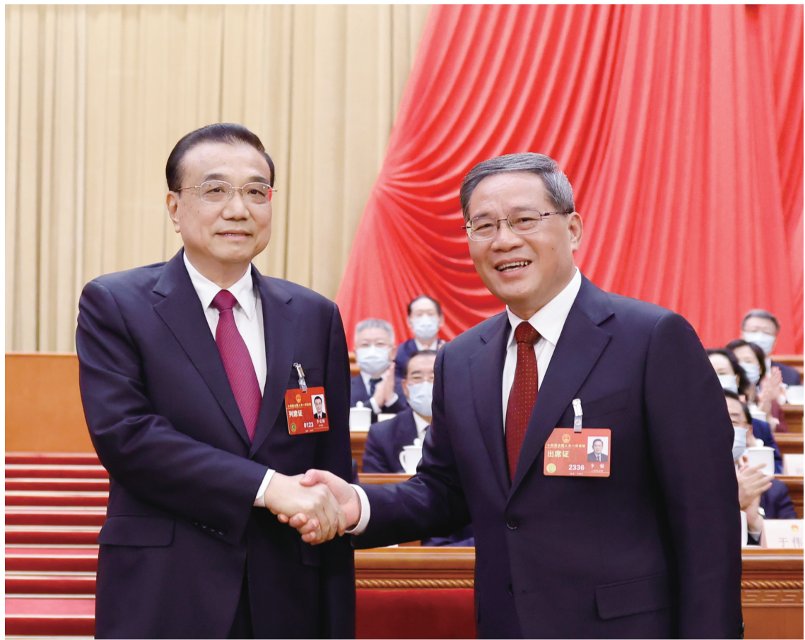
三月十一日,十四届全国人大一次会议在北京人民大会堂举行第四次全体会议,根据国家主席习近平的提名,经过投票表决,决定李强为中华人民共和国国务院总理。这是李强同李克强握手。