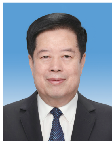
国家监察委员会主任 刘金国

刘金国,男,汉族,1955年4月生,河北昌黎人,1976年12月参加工作,1975年9月加入中国共产党,中央党校大学学历。 现任中共二十届中央书记处书记,中央纪律检查委员会副书记,国家监察委员会主任,总监察官。