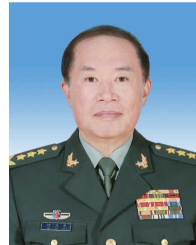
中华人民共和国中央军事委员会副主席 何卫东

张又侠,男,汉族,1950年7月生,陕西渭南人,1968年12月入伍,1969年5月加入中国共产党,军事学院基本系毕业,大专学历。 现任中共二十届中央政治局委员,中共中央军事委员会副主席,中华人民共和国中央军事委员会副主席,陆军上将军衔。 何卫东,男,汉族,1957年5月生,江苏东台人,1972年12月入伍,1978年11月加入中国共产党,中央党校大学学历。 现任中共二十届中央政治局委员,中共中央军事委员会副主席,中华人民共和国中央军事委员会副主席,陆军上将军衔。 (新华社北京3月11日电)