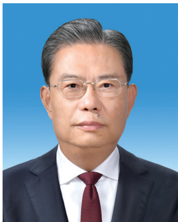
第十四届全国人民代表大会常务委员会委员长 赵乐际

赵乐际,男,汉族,1957年3月生,陕西西安人,1974年9月参加工作,1975年7月加入中国共产党,北京大学哲学系哲学专业毕业,中央党校研究生学历。