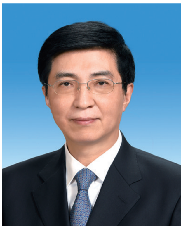
中国人民政治协商会议第十四届全国委员会主席 王沪宁

现任中共二十届中央政治局常委,十四届全国人大常委会委员长。 (新华社北京3月10日电)