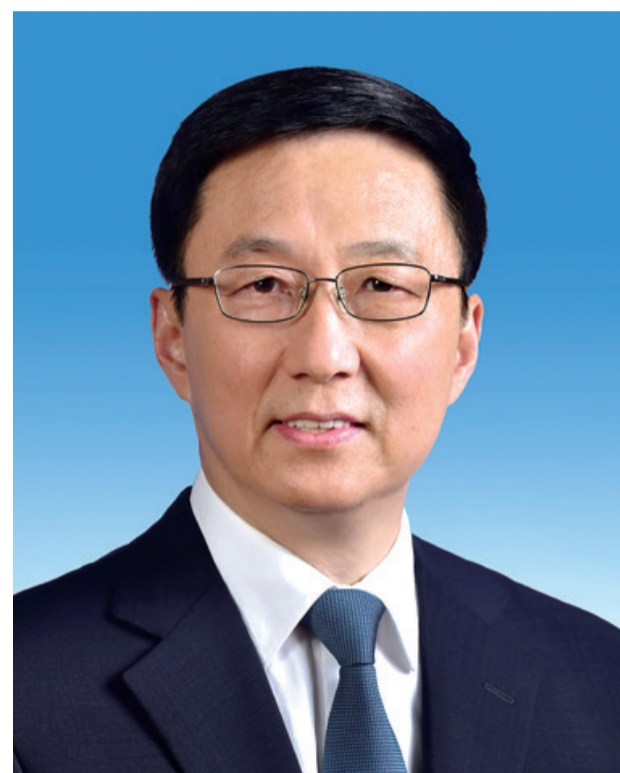
中华人民共和国副主席 韩正

现任中共二十届中央政治局常委,十四届全国政协主席,中央全面深化改革委员会办公室主任。 (新华社北京3月10日电)