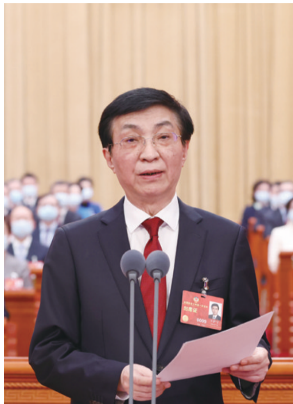
3月4日,中国人民政治协商会议第十四届全国委员会第一次会议在北京人民大会堂开幕。王沪宁主持开幕会。

新华社北京3月4日电 踔厉奋发共襄复兴伟业,勇毅前行再谱时代华章。历经光辉岁月、坚持团结和民主两大主题的人民政协,又迎来一个重要的历史时刻:中国人民政治协商会议第十四届全国委员会第一次会议4日下午在人民大会堂开幕。 三月北京,春意盎然。人民大会堂万人礼堂内灯光璀璨,气氛庄重热烈。中国人民政治协商会议会徽悬挂在主席台正中,十面鲜艳的红旗分列两侧。 全国政协十四届一次会议应出席委员2169人,实到2132人,符合规定人数。 全国政协十四届一次会议主席团常务主席王沪宁、石泰峰、胡春华、沈跃跃、王勇、周强、帕巴拉·格列朗杰、何厚铨、梁振英、巴特尔、苏辉、邵鸿、高云龙在主席台前排就座。 党和国家领导人习近平、李克强、栗战书、汪洋、李强、赵乐际、韩正、蔡奇、丁薛祥、李希、王岐山等在主席台就座,祝贺大会召开。 下午3时,王沪宁宣布大会开幕,全体起立,高唱中华人民共和国国歌。