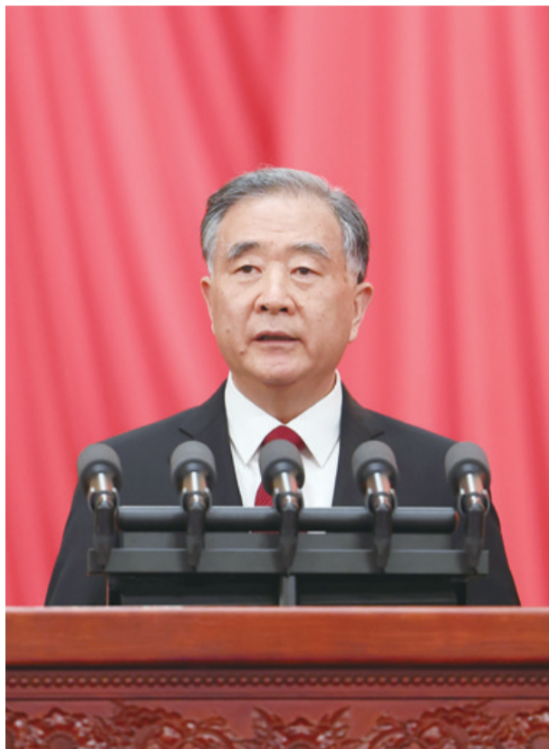
3月4日,中国人民政治协商会议第十四届全国委员会第一次会议在北京人民大会堂开幕。十三届全国政协主席汪洋代表政协第十三届全国委员会常务委员会向大会报告工作。