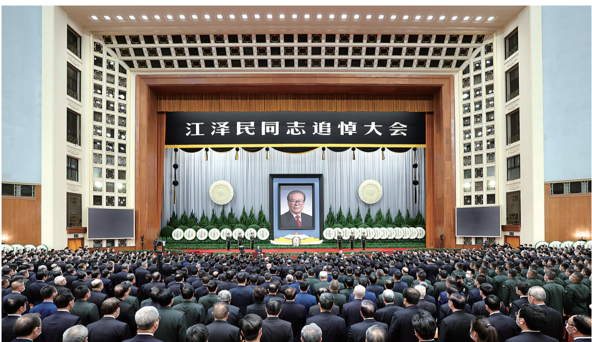
12月6日，中共中央、全国人大常委会、国务院、全国政协、中央军委在北京人民大会堂隆重举行江泽民同志追悼大会。