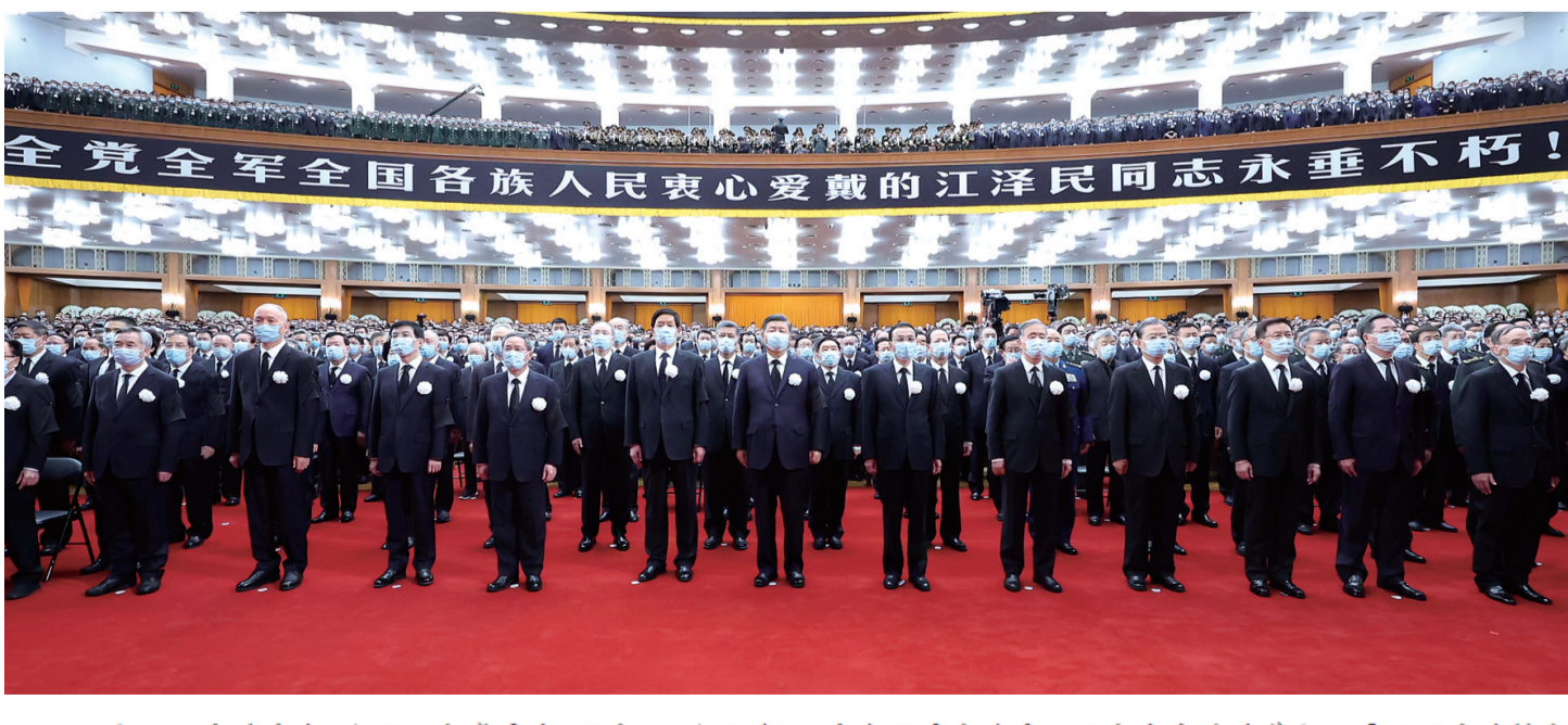
12月6日，中共中央、全国人大常委会、国务院、全国政协、中央军委在北京人民大会堂隆重举行江泽民同志追悼大会。习近平、李克强、栗战书、汪洋、李强、赵乐际、王沪宁、韩正、蔡奇、丁薛祥、李希、王岐山等参加大会。