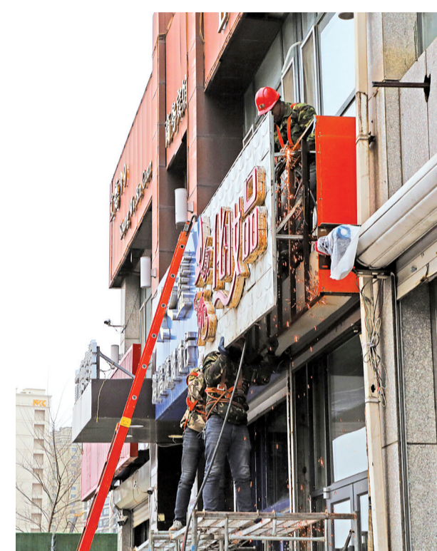
工人拆除不符合规范的沿街牌匾。

本报讯(记者 张莹莹)为进一步提升辖区市容市貌,打造高质量发展的城市环境和良好的营商环境,助力“创城”,11月11日,开发区城管大队切实加强户外广告牌匾管理,开展了广告牌匾专项整治行动。截至目前,共拆除辖区内老旧牌匾280余块,违规广告、独体字26处,计划11月底完成友谊大路两侧牌匾改造项目,进一步提升城市视觉美感,带给居民群众更多的幸福感获得感。 违法建设的拆除、市容环境的改善,为的是人民群众的满意、创建“全国文明城市”、践行全心全意为人民服务的宗旨,也是城市管理工作的本质要求。今年以来,开发区城管大队开展的辖区内市容市貌专项整治工作,整治内容包括小区内违法建筑物、构筑物、自建房、彩钢房、小区内的私搭乱建及私自开垦小片荒,沿街牌匾统一规划改造。城管大队出动执法人员730余人次,执法车辆210余车次,排查辖区各类建筑171栋,重点针对星河万源财富园、三海尚城等小区开展工作部署。截至目前,拆除违法自建房24处、彩钢房32处、围栏565米、楼顶违规构筑物铁架122处、太阳能热水器230个、小片荒320平方米,共拆除违法建设187处,整治违法建设面积约