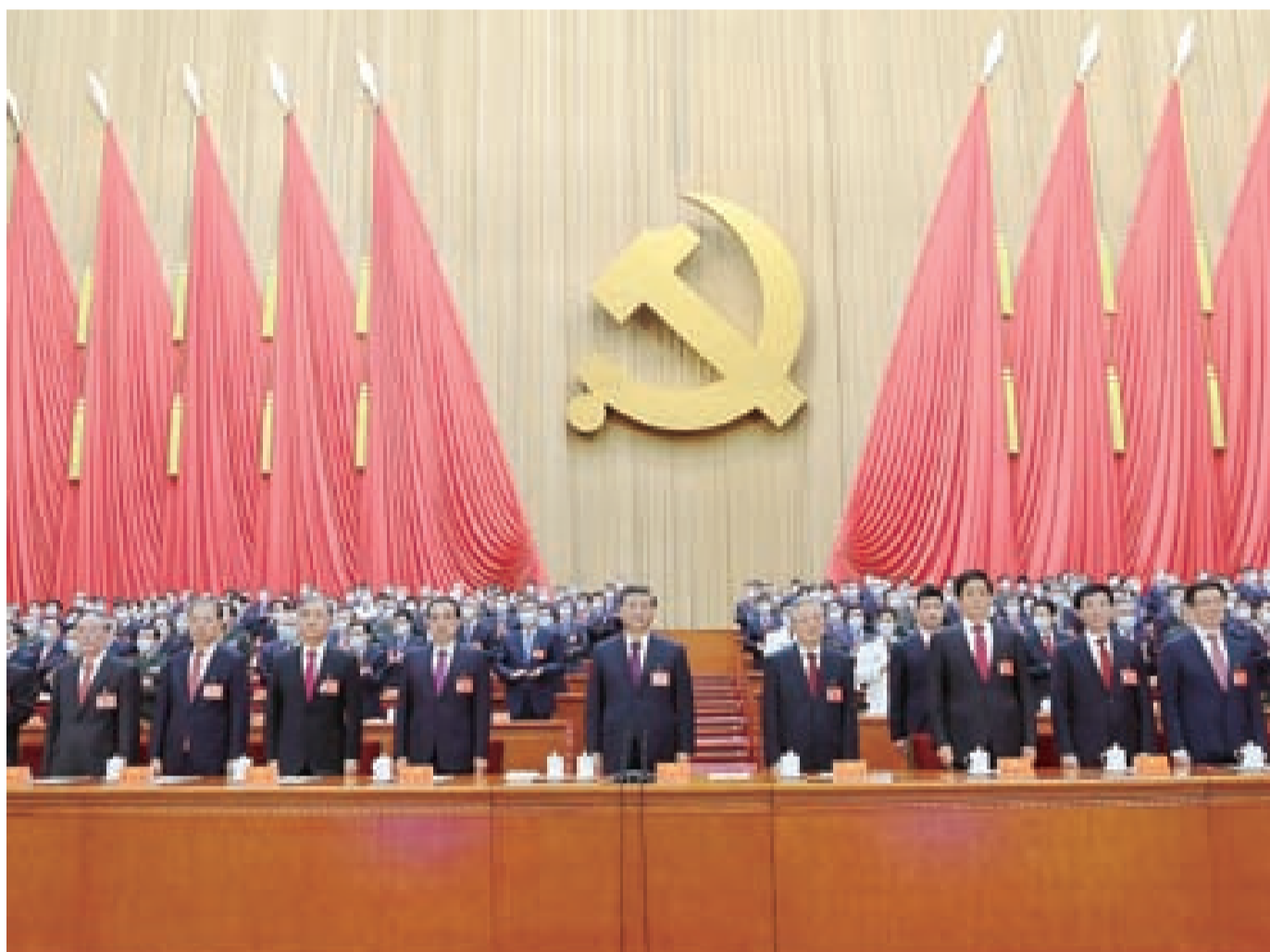
10月22日,中国共产党第二十次全国代表大会在北京人民大会堂胜利闭幕。这是习近平、李克强、栗战书、汪洋、王沪宁、赵乐际、韩正、王岐山、胡锦涛等在主席台上。