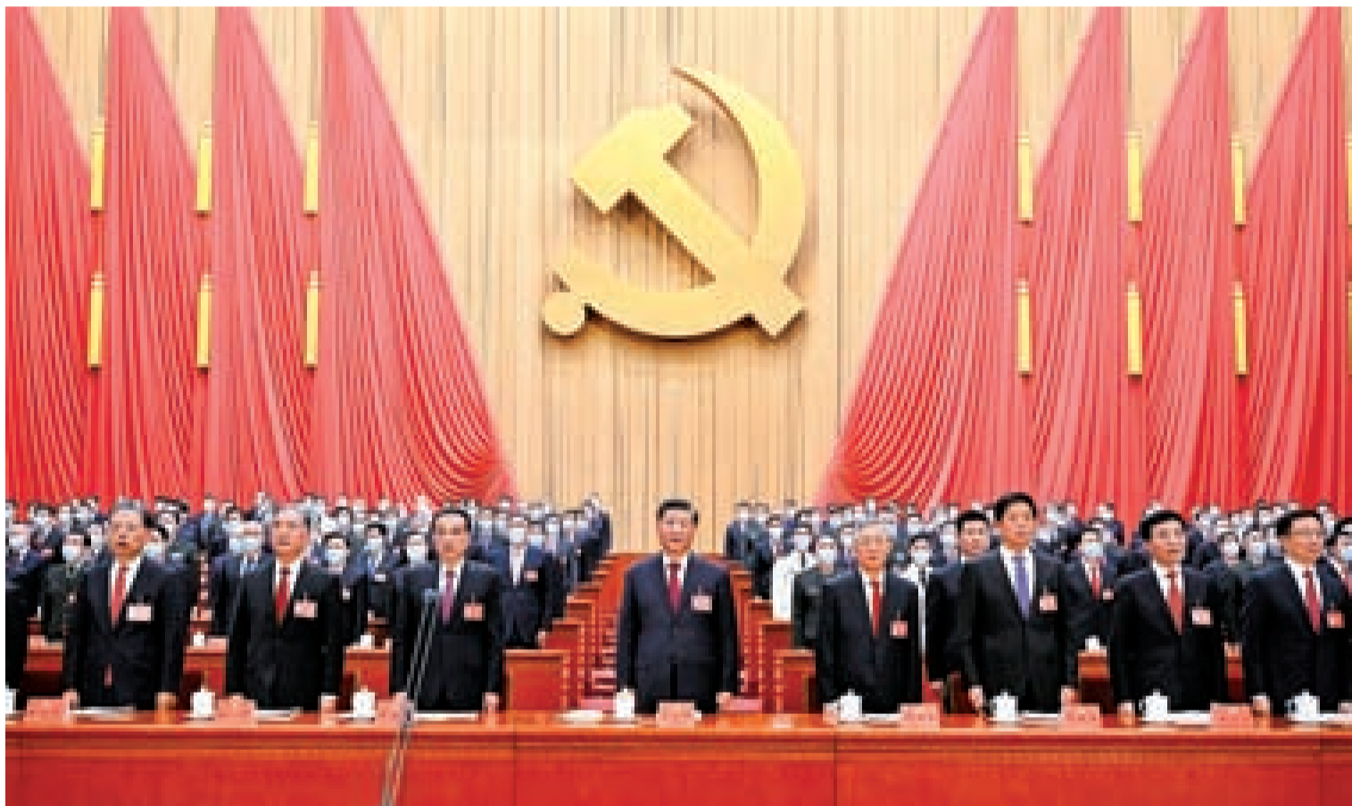
10月16日,中国共产党第二十次全国代表大会在北京人民大会堂开幕。习近平代表第十九届中央委员会向大会作报告。