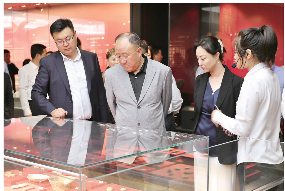
9月14日,市委书记柴伟到南部新城“四馆”调研。图为柴伟在南部新城博物馆了解相关情况。

本报讯(记者 王茵)9月14日下午,市委书记柴伟到南部新城“四馆”调研,并召开座谈会,听取运行管理情况汇报。他强调,要挖掘潜力,释放活力,充分开发利用“四馆”资源,进一步繁荣文化事业,发展文化产业,满足人民群众精神文化需求。