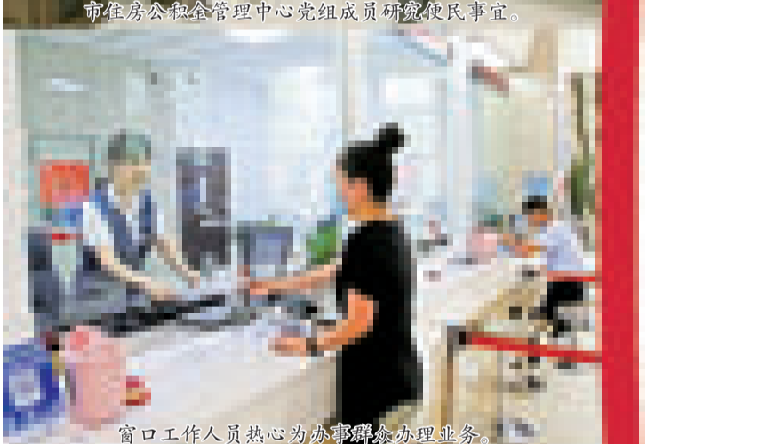
窗口工作人员热心为办事群众办理业务。