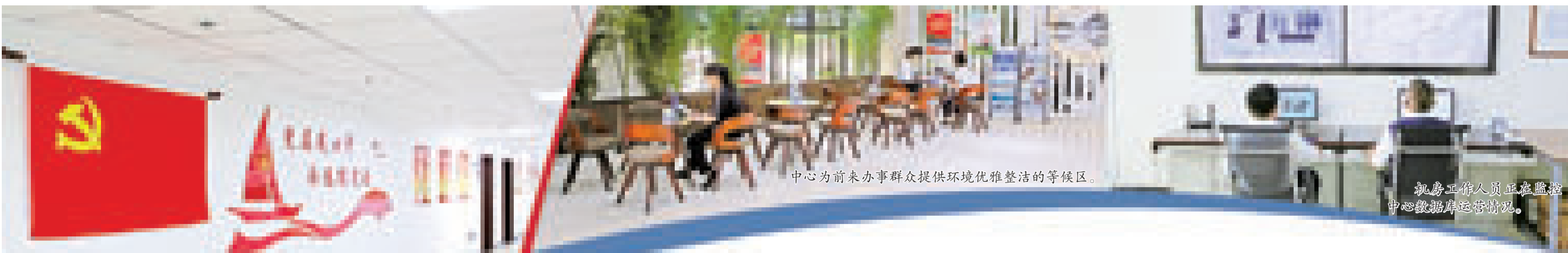
中心为前来办事群众提供环境优雅整洁的等候区。