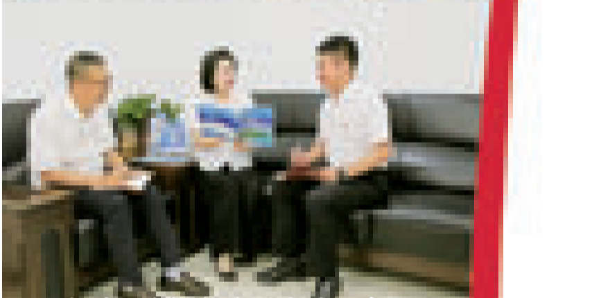
市住房公积金管理中心党组成员研究便民事宜。