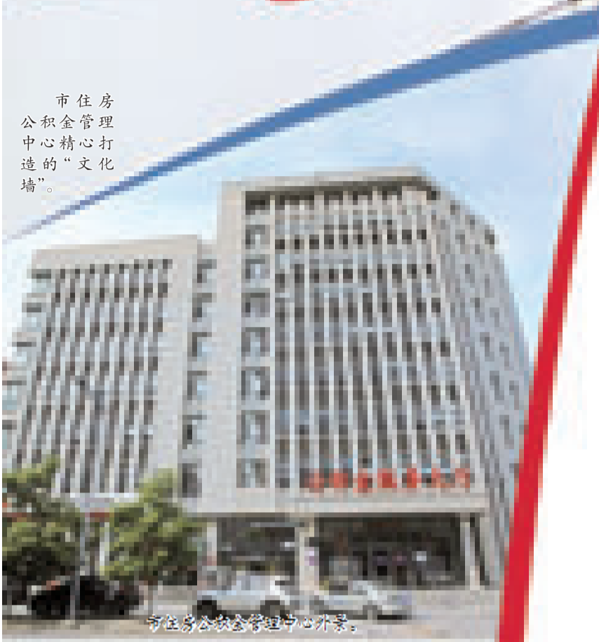
市住房公积金管理中心外景。

本版稿件由本报记者 李锋 采写 本版策划 戚凯慧