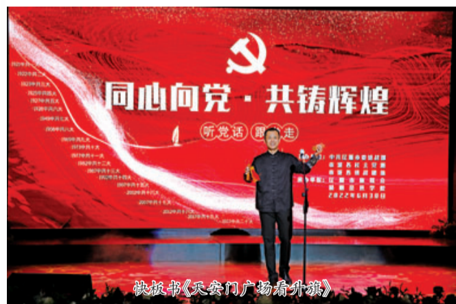
快板书《天安门广场看升旗》