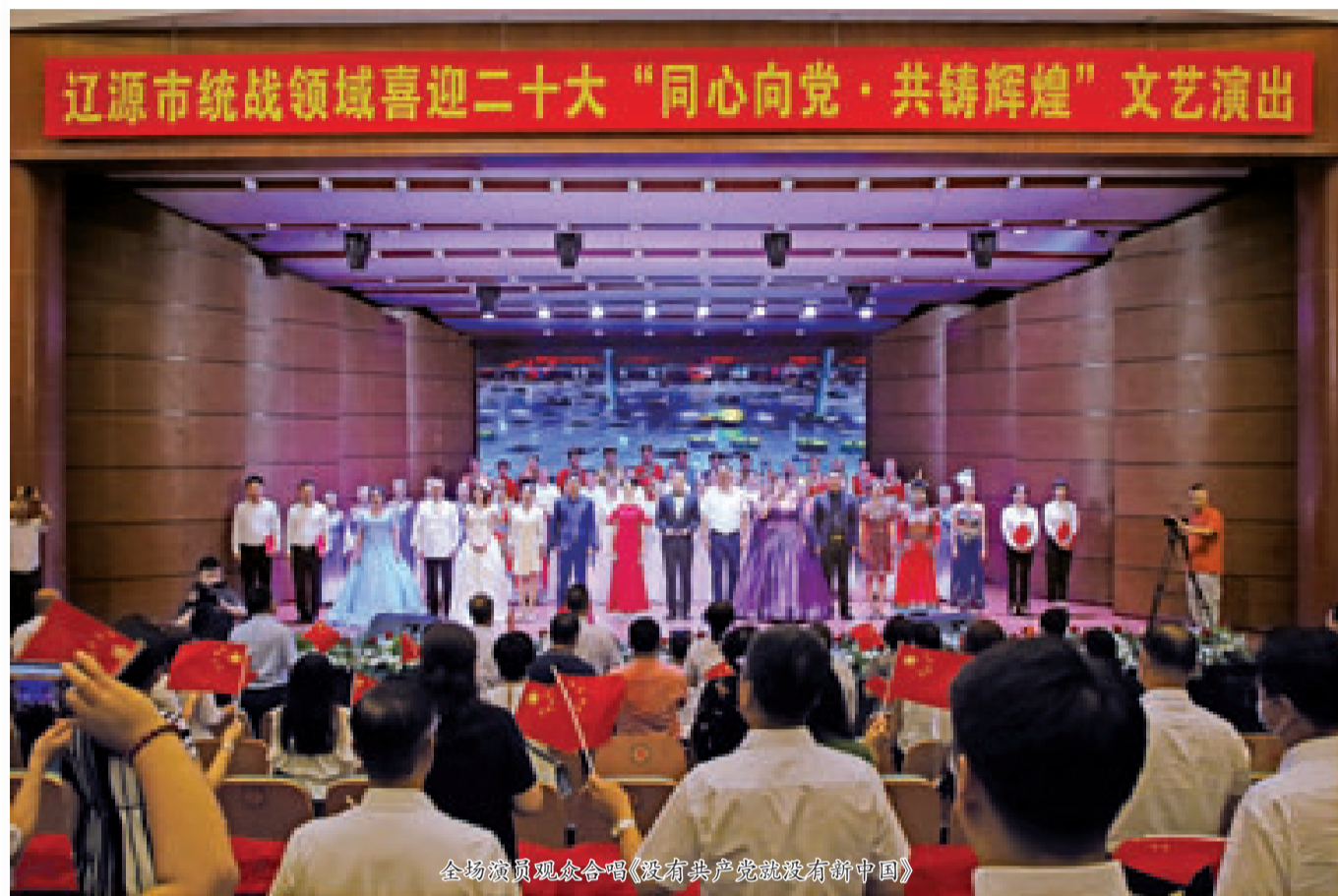
全场演员观众合唱《没有共产党就没有新中国》

整场精彩纷呈的节目使得全场观众沉浸在浓厚的爱党爱国热情之中。演员们用精湛的表演颂党的恩情、用真挚情感表达对党的祝福,充分彰显了广大统战成员凝心聚力、共创未来的使命担当,进一步增强了听党话、跟党走、与党同心奋斗的思想自觉、行动自觉。新阶段赋予新任务、新征程肩负新使命,全市统一战线将踔厉奋发、笃行不怠,以优异成绩向党的二十大献礼!