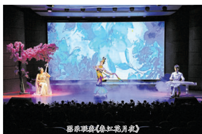
器乐联奏《春江花月夜》