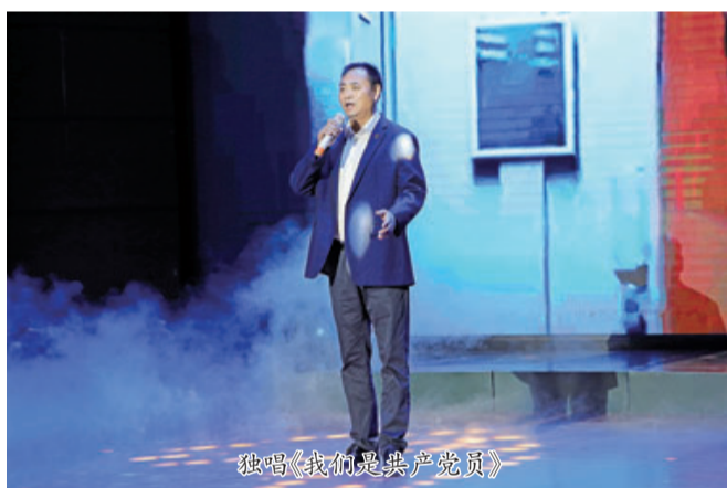
独唱《我们是共产党员》