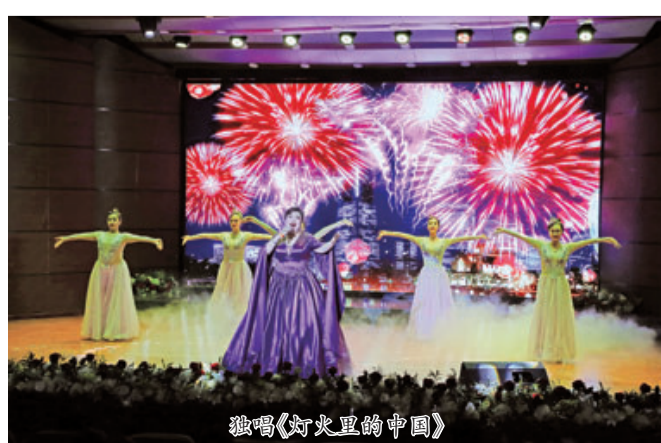
独唱《灯火里的中国》