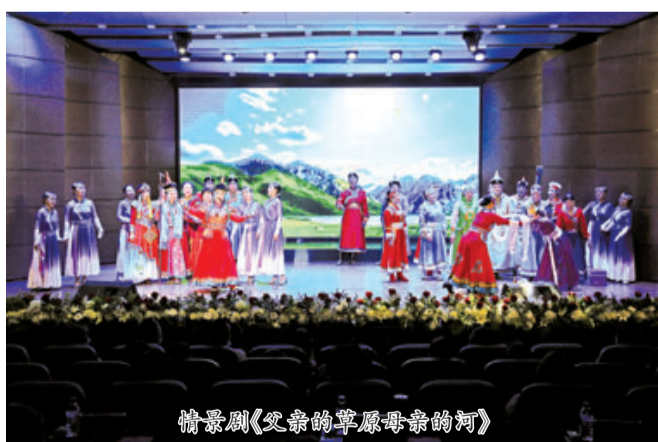
情景剧《父亲的草原母亲的河》