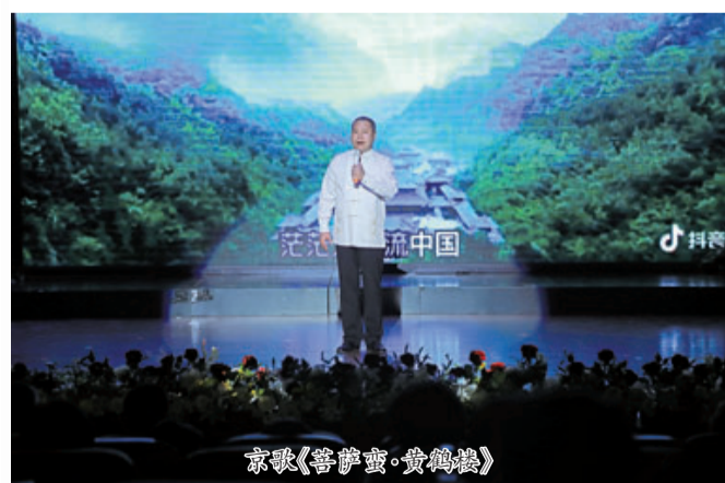
京歌《菩萨蛮·黄鹤楼》