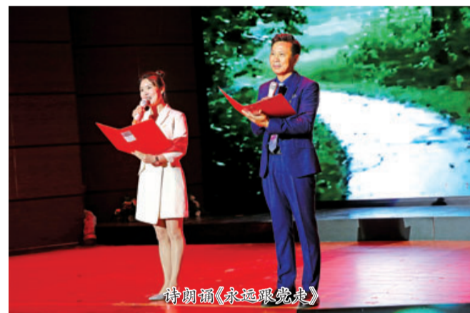
诗朗诵《永远跟党走》