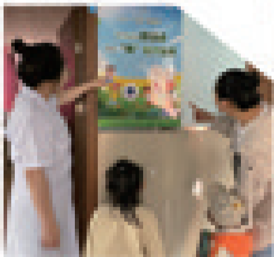
向来入托体检的家长宣传爱眼日活动

绕第27个全国“爱眼日”“关注普遍的眼健康,共筑“睛”彩大健康”活动主题,辽源市妇幼保健计划生育服务中心开展一系列“爱眼日”主题宣传活动,形成从线上到线下,从社区到托幼机构的立体宣传模式。