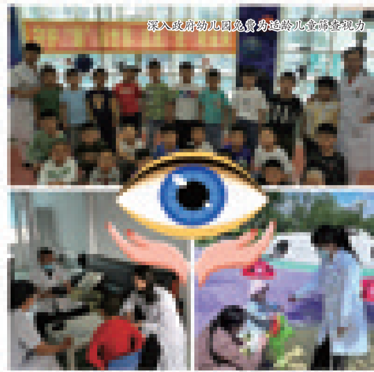
深入政府幼儿园免费为适龄儿童筛查视力

良好用眼习惯的理念。在开展日常儿童保健门诊工作中,结合儿童入托健康体检,积极做好儿童眼保健知识宣传及视力筛查工作,针对视力异常儿童做好定期追踪随访。及时告知家长加强儿童用眼卫生,儿童和青少年居家期间,家人应利用有限的条件,积极督促其进行身体活动,避免长时间久坐,每坐1小时要站起来动一动,减少上网课以外的电子产品使用时间,积极创造全社会良好的用眼环境。