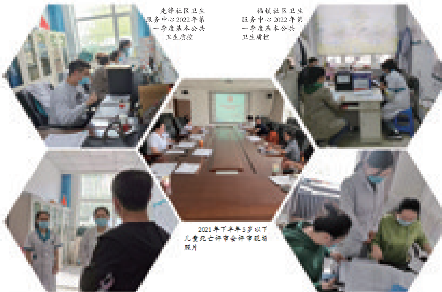
先锋社区卫生服务中心2022年第一季度基本公共卫生质控

建立转诊制度,在基层社区、乡镇卫生院建立高危儿童转诊制度,提高高危儿童救治可及性;建立登记制度,在产科单位和非医疗机构设立高危儿童登记制度,对辖区内高危儿童进行登记管理、定期随访、记录诊断和干预结果;建立宣传制度,在开展各项妇幼服务过程中,针对农村留守儿童这一特殊群体,加大儿童保健和安全教育的宣传力度,提高家长安全意识,全力避免儿童意外死亡发生。