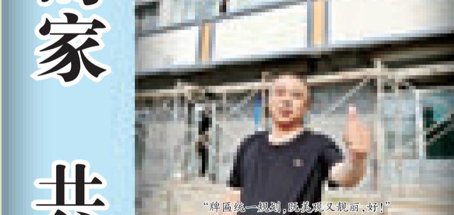
“牌匾统一规划,既美观又靓丽,好!”