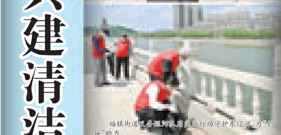
福镇街道义务巡河队用实际行动守护东辽河,为“创城”助力。