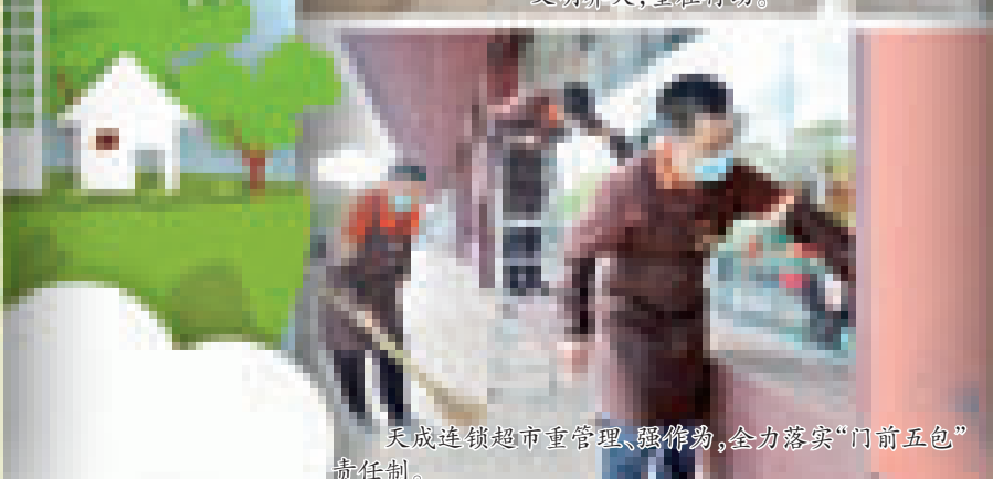
天成连锁超市重管理、强作为,全力落实“门前五包”责任制。