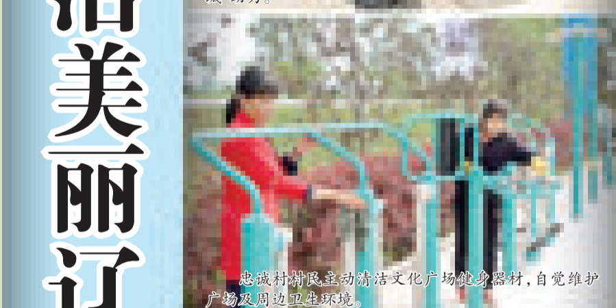
忠诚村村民主动清洁文化广场健身器材,自觉维护广场及周边环境卫生。