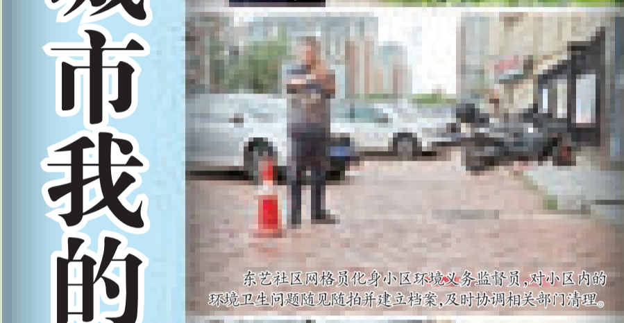
东艺社区网格员化身小区环境义务监督员,对小区内的环境卫生问题随时拍照并建档,及时协调相关部门清理。