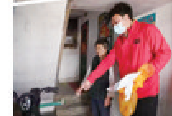
本版稿件由本报记者 祝琪尧 采写 本版策划 咸凯慧