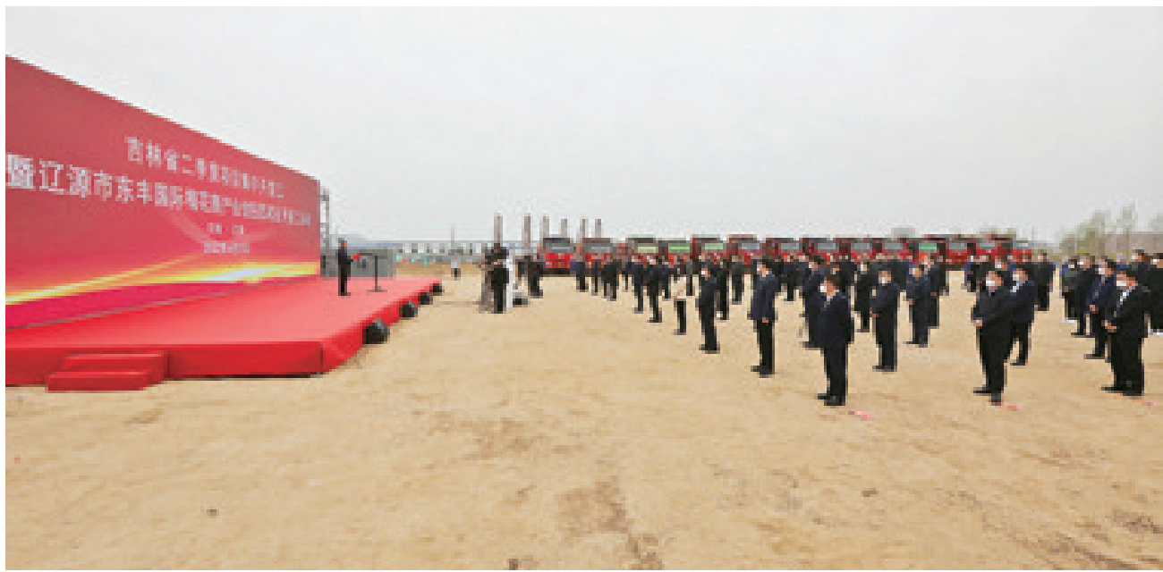
4月28日,全省第二季度项目集中复工活动在长春新区举行,我市在东丰国际梅花鹿产业创投园分会场参加活动。

记者在开工现场了解到,年初以来,特别是本轮疫情发生后,我市立足疫情实际,坚持统筹疫情防控和经济社会发展,咬定年初既定发展目标不动摇,坚持把复工复产和项目建设牢牢抓在手上,努力将疫情对生产生活的影响降到最低。一季度,全市地区生产总值增长5.4%,位列全省第二位;农林牧渔业总产值增长15.1%,位列全省第二位;规模以上工业增加值、增加值分别增长38.5%和28.6%,均列全省第一;建筑业产值增长40.6%,位列全省第一位;固定资产投资增