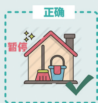
中高风险地区, 建议在疫情期间暂停钟点工、多点执业家政服务的应用, 避免造成交叉感染