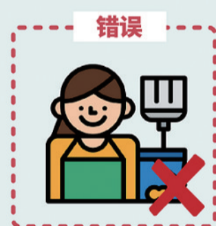
中高风险地区, 使用钟点工