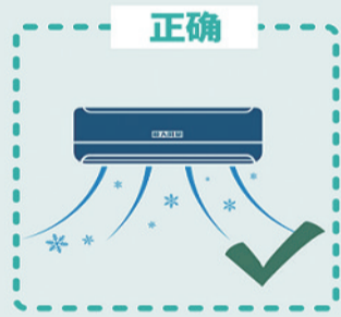
使用前应彻底清理, 并以最大新风量运行, 如出现病例时, 应停用并进行终末消毒