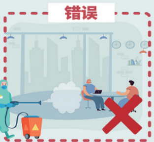
在大堂、活动中心等有人情况下, 向人群喷洒消毒剂