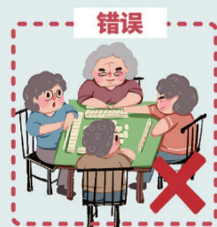
中高风险地区, 社区活动中心、棋牌室正常营业