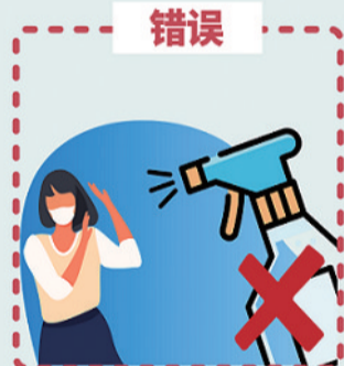
在小区入口拉消毒带, 对居民喷洒消毒剂