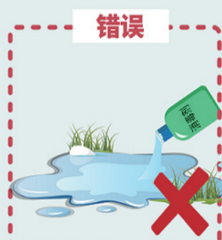
对小区水体投放消毒剂