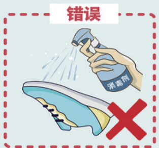
向路人鞋底喷洒消毒剂