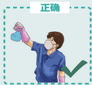
在每日使用前后用含氯消毒剂擦拭地板、座椅、运动器械、扶手等