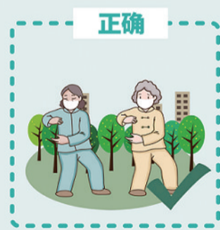
中高风险地区, 建议社区室内活动中心、棋牌室等暂停营业, 室外露天活动可继续组织, 但应避免人群聚集, 做好防护