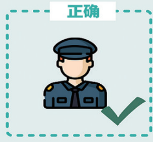
疫情期间, 中高风险地区公共场所服务人员建议专人专岗, 不要混排, 不可随意串岗