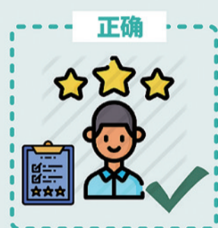
疫情期间, 上述工作人员应按照防疫法、第八版防控指南要求, 接受培训并考核通过后才能上岗