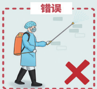
在小区墙壁、地面、车轮喷洒消毒剂