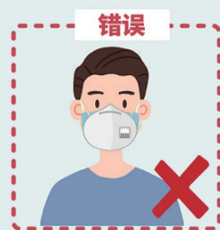
一只口罩长期反复使用, 使用无防护效果的普通口罩