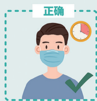
应配发医用外科口罩或以上防护级别口罩, 最长使用时间为4小时