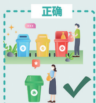
开展爱国卫生运动, 做好垃圾分类清运; 夏季还要注意水体蚊虫滋生, 可以向水体中投放杀蚊幼剂