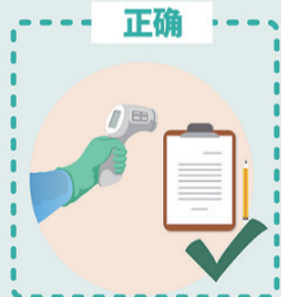
小区门岗设置体温监测、做好出入人员登记