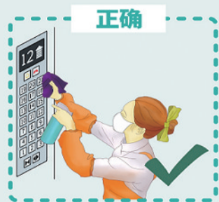
小区高频接触的环境物表, 如单元门把手、电梯按键, 应每天至少消毒一次, 建议用含氯消毒剂擦拭消毒