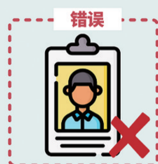
公共场所工作人员不经培训直接上岗