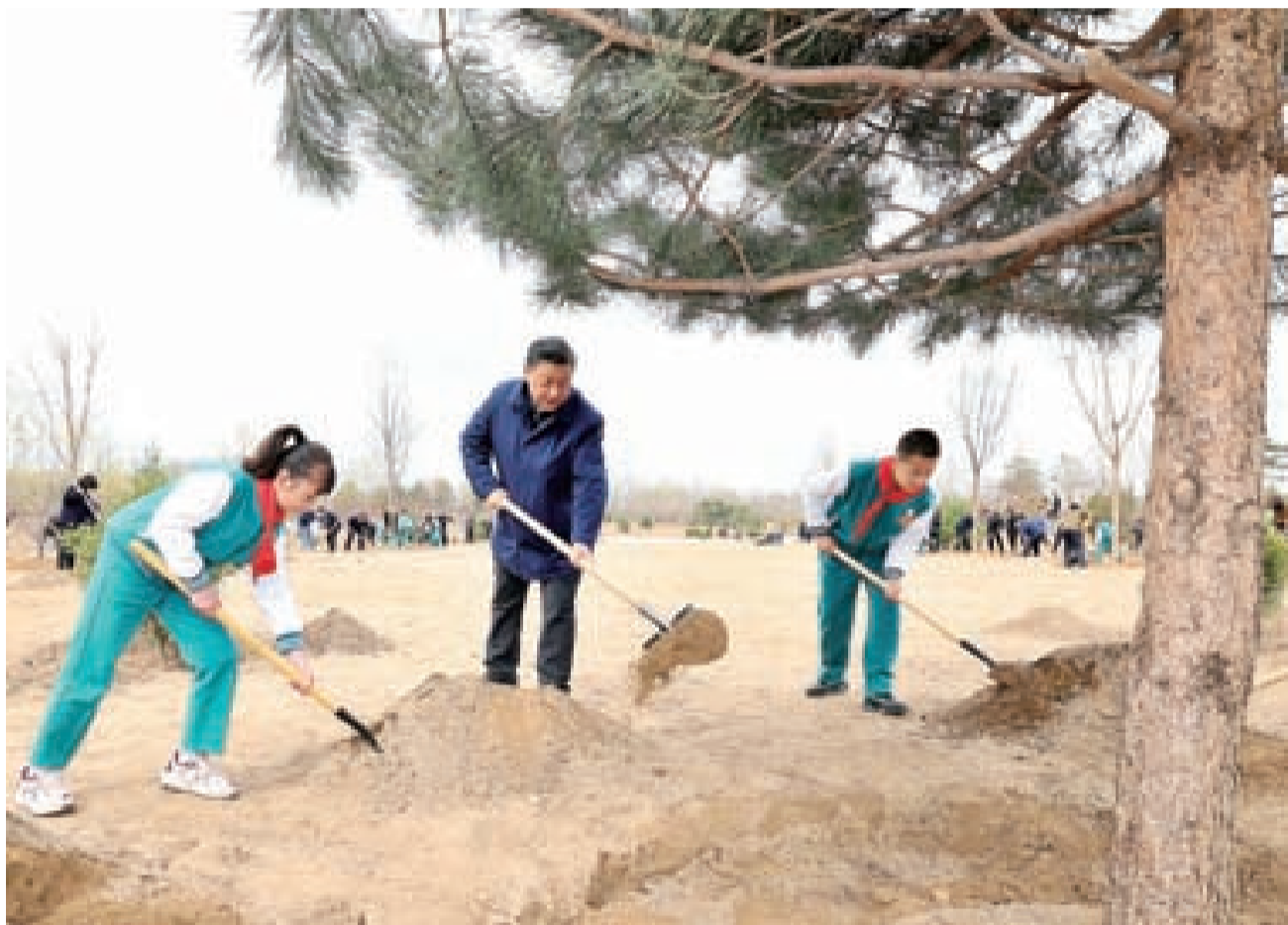
3月30日,党和国家领导人习近平、李克强、栗战书、汪洋、王沪宁、赵乐际、韩正、王岐山等来到北京市大兴区黄村镇参加首都义务植树活动。这是习近平同大家一起植树。

挥锹铲土、培土围堰、提水浇灌……习近平接连种下油松、碧桃、白玉兰、海棠、小叶白蜡等多棵树苗。习近平一边劳动,一边询问孩子们学习生活情况,叮嘱他们要德智体美劳全面发展,不能忽视“劳”的作用,从小培养劳动意识、环保意识、节约意识,勿以善小而不为,从一点一滴做起,努力成长为党和人民需要的有用之才。植树现场一派繁忙景象,