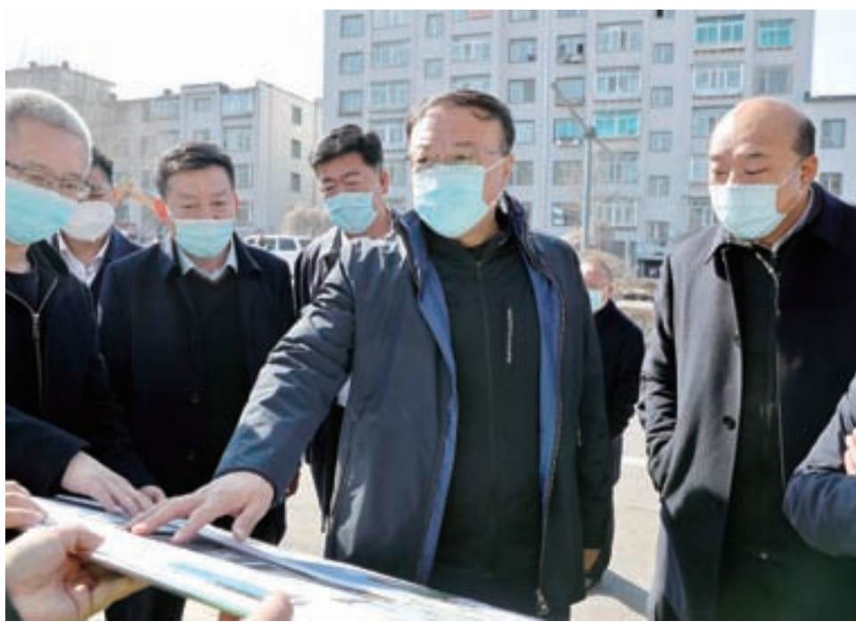
3月31日,市委副书记、市长程宇调研2022年全市新开工市政项目建设工作。图为程宇在连心桥了解相关情况。

在连心桥拓宽改造、烟辽辽线道路改造、红五星立交桥征拆、永安桥段盖板楼征拆、一建道口A派酒店征拆等市政工程现场,程宇听汇报、看展板、问情况,详细了解各工程建设进度及存在的问题。他强调,市政工程关系民生、关乎城市发展。要坚持以人为本,立足实际、着眼长远,科学规划布局,精细各作业环节,高质高效完成建设任务。要抢抓施工黄金期,加快工程施工进度,制定时间表、路线图,有序有效紧密推动,确保工程早建成、早见效。要坚持问题导向,目