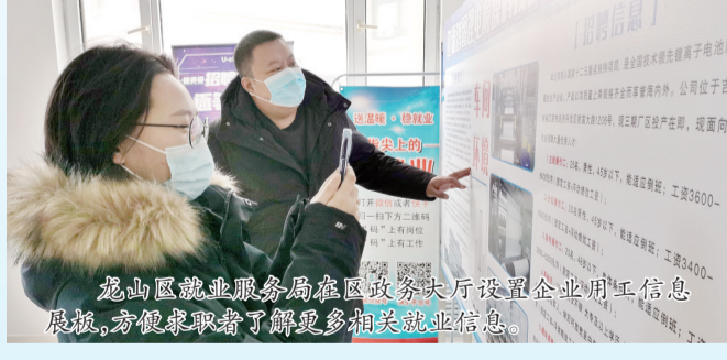
龙山区就业服务局在政务大厅设置企业用工信息展板,方便求职者了解更多相关就业信息。