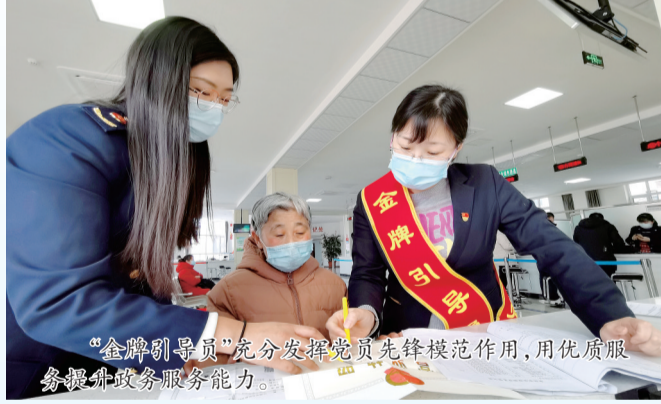
“金牌引导员”充分发挥党员先锋模范作用,用优质服务提升政务服务能力。