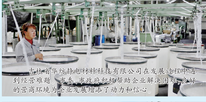
吉林省华纺静电材料科技有限公司在发展过程中遇到经营难题,市委、市政府积极帮助企业解决困难,良好的营商环境为企业发展增添了动力和信心。