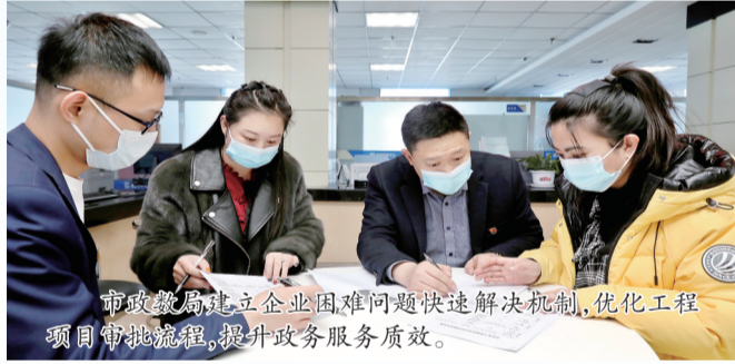
市政数局建立企业困难问题快速解决机制,优化工程项目审批流程,提升政务服务质效。