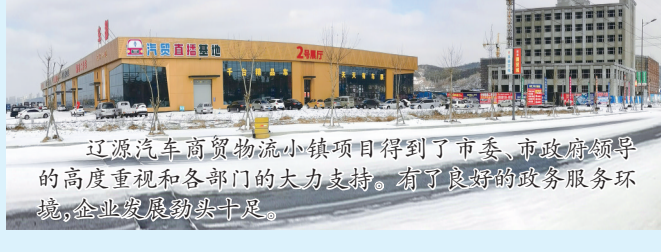
辽源汽车商贸物流小镇项目得到了市委、市政府领导的高度重视和各部门的大力支持,有了良好的政务服务环境,企业发展势头十足。