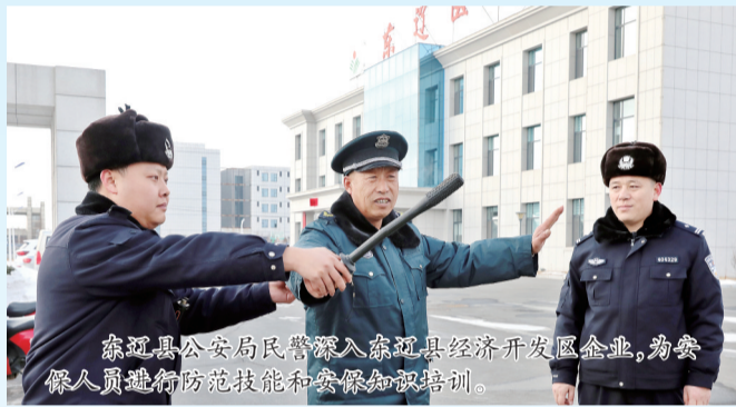
东辽县公安局民警深入东辽县经济开发区企业,为警企人员提供防范技能和安全隐患知识培训。