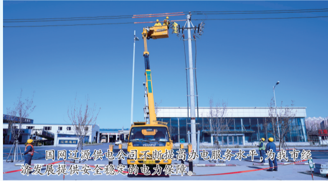
国网辽源供电公司不断提升办电服务水平,为我市经济发展提供安全稳定的电力保障。