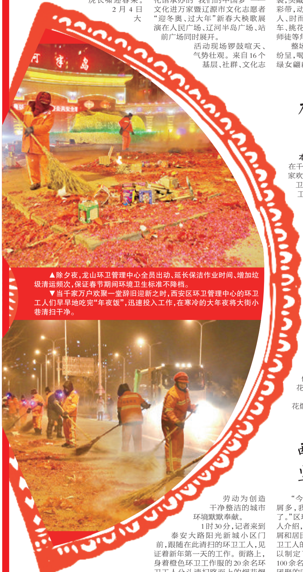
▲除夕夜,龙山环卫管理中心全员出动、延长保洁作业时间、增加垃圾清运频次,保证春节期间环境卫生标准不降档。